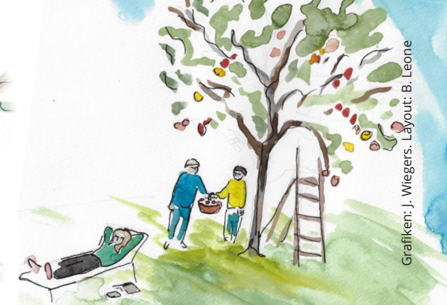
Grafiken: J. Wieggers. Layout: B. Leone