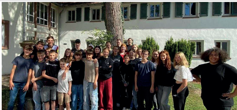
Konfirmanden-Freizeit im September 2025