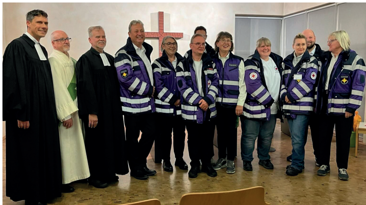
Impressionen vom Blaulichtgottesdienst am 25. September und vom Erntedank-Gottesdienst mit der NAJU am 28. September