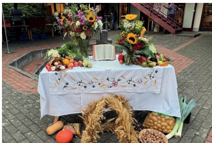
Schöner Altar am Gemeindefest

Mit Bewegungen, Gesten und viel Gesang haben sie die Geschichte des Liedes lebendig werden lassen. Die Eltern und die Gemeinde haben sich spürbar mitgeföhrt. Für die Kinder war es ein aufregender Moment, vor so vielen Menschen zu singen und zu zeigen, was sie eingeübt hatten.