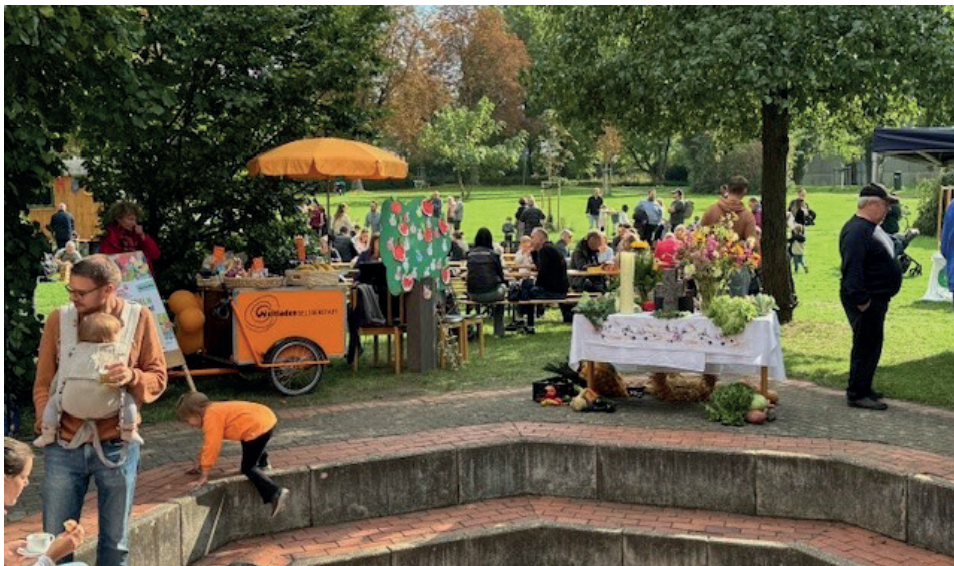
Gemeindefest und Erntedank feierte die Ortskirchengemeinde Seligenstadt und Mainhausen am 28. September am Gemeindezentrum Seligenstadt.

Es weihnachtete mitten im September beim Strohsterne-Workshop in Seligenstadt. Der Schmuck für den Weihnachtsbaum in der Evangelischen Kirche Seligenstadt benötigte eine Runderneuerung: gebrochene und ausgefranzte Strohhalme