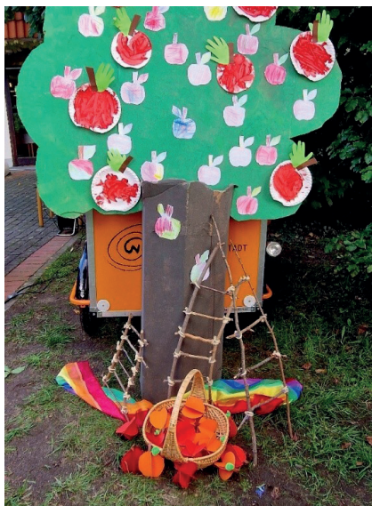
Unser fertiger Apfelbaum, gestaltet von den Kita- und Krippen-Kindern

Die Familien konnten anschließend mit ihren Kindern an dem Gemeindefest teilnehmen, es gab viele tolle Spielmöglichkeiten.