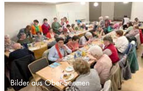
Bilder aus Ober-Seemen

Im Gemeindehaus Wenings wurde der Gottesdienst von sieben Frauen aus Wenings und Merkenfritz vorbereitet. Musikalisch bereicherte der Chor der Kirchengemeinde „Rock my Soul“ die Feier und sorgte für eine besonders festliche Atmosphäre. Rund 60 Besucherinnen und Besucher aus Wenings, Merkenfritz und weiteren Orten nahmen daran teil.