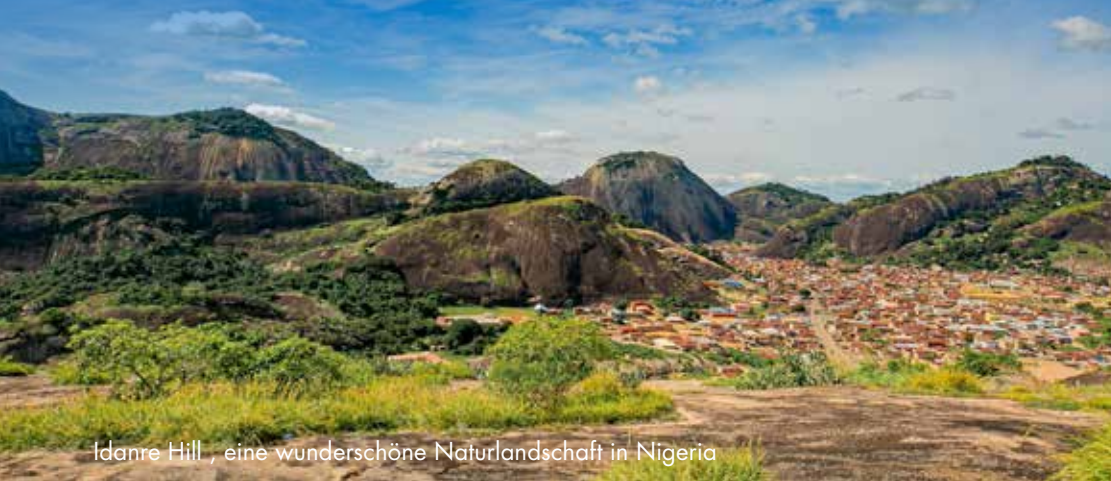
Idanre Hill, eine wunderschöne Naturlandschaft in Nigeria

Am Freitag, dem 06. März 2026, feierten die Gemeinden Gedern, Kefenrod, Ober-Seemen und Wenings jeweils den Weltgebetstag – in diesem Jahr unter dem bewegenden Motto „Kommt! Bringt eure Last“.