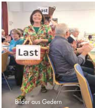
Bilder aus Gedern

Die liturgische Gestaltung lag in den Händen engagierter Frauen aus unseren Gemeinden, die mit viel Kreativität und Liebe zum Detail eindrucksvolle Gottesdienste vorbereitet hatten. Die Texte, Gebete und Lieder nahmen die Erfahrungen nigerianischer Frauen auf und machten ihre Hoffnungen, Sorgen und ihre Glaubenskraft für uns spürbar.