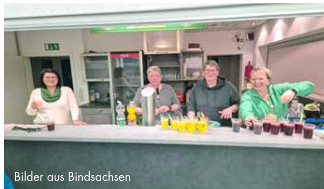
Bilder aus Bindsachsen