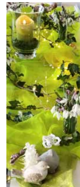
mit Schneeglöckchen verabschiedet der Frauenkreis im März die Winterzeit

Die letzten 30 Minuten stand Bingo im Mittelpunkt und die Konfirmandinnen spielten begeistert mit. Text: Monika Schermuly