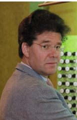
in Zusammenarbeit mit KulturSINN Rhein-Selz