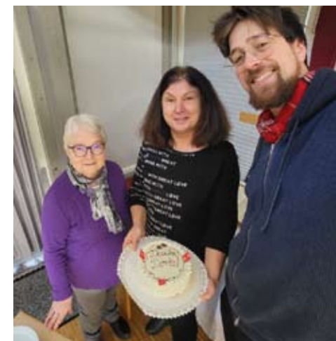
Bilder: Dorothea Hartmann