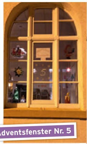
Adventsfenster Nr. 5

Beim gut besuchten Weihnachtsmarkt sorgten wir für die passende Weihnachtsstimmung. Ob traditionell oder modern, so erschallte die Musik von der Treppe über den Markt. Vorfreude auf Weihnachten pur!