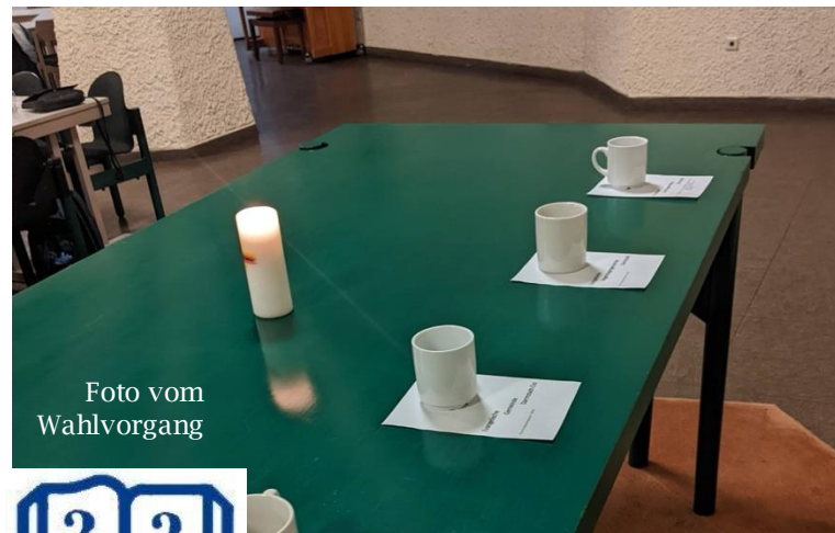
Foto vom Wahlvorgang