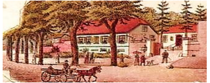
Abb. 1: Kutscherhaus (früheres Gaststättengebäude) und Einfahrtstor zum Anwesen nördlich der Dieburger Straße (Ausschnitt aus einer Bildpostkarte von 1897)

stätte diente. 1822 folgte der Schustermeister Egidius Hotze mit dem Bau eines zweigeschossigen Hauses südlich der Dieburger Straße.