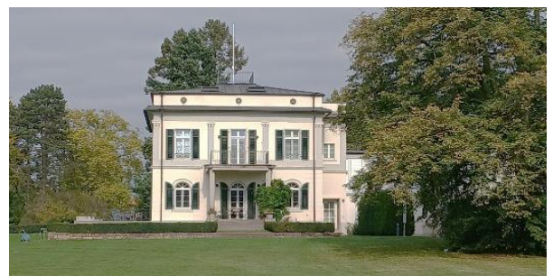
Abb. 2: Villa Flotow südlich der Dieburger Str.