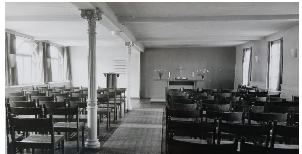
Abb. 4: Gottesdienstraum Ende der 1950er Jahre im Kutscherhaus

Nicht nur auf dem Heiligkreuzberg, auch im übrigen Gebiet des heutigen Komponistenviertels nahm im 20. Jahrhundert die Besiedelung stark zu. Deshalb fasste die evang. Martinsgemeinde den Beschluss, ab 1956 dieses Gebiet als Ostbezirk abzugrenzen. 1957 erhielt der Ostbezirk den Namen „Thomasbezirk“ und 1961 wurde er mit der Einweihung eines neuen Gemeindezentrums an der Flotowstraße zur selbständigen Thomasgemeinde .