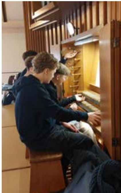
Konfis testen die Orgel

In jedem Jahr staunen wir, wie schnell dann doch die Zeit verfliegt. Denn unsere Konfizeit ist nun schon fast vorbei.