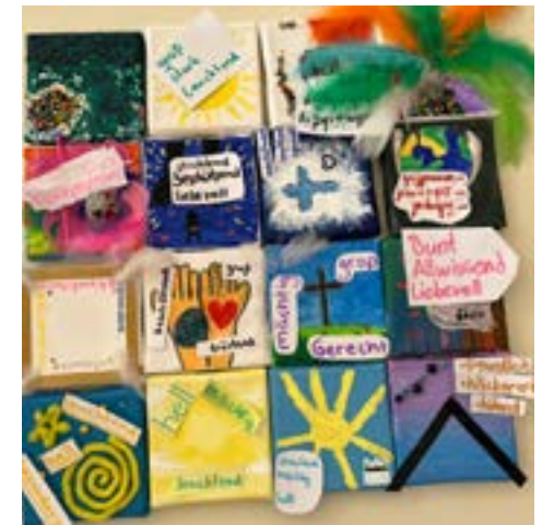
Wie ist Gott? - darüber haben wir kreativ nachgedacht