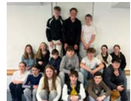
Gruppenbild der Gruppe 2, die dienstags in Garbenteich Konfiunterricht hatte