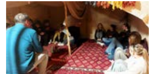
Im Bibelmuseum haben wir mit Abraham und Sarah das Alte Testament erlebt.