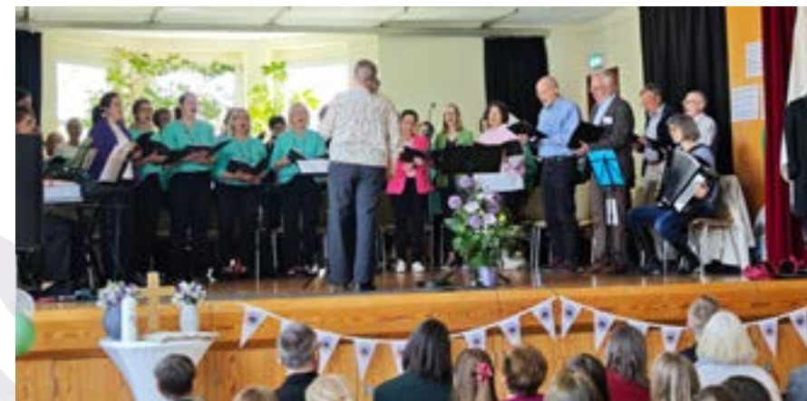
Festgottesdienst mit viel Musik

Die Musik kam vom Evangelischen Kirchenchor „Gospel and more“ aus Steinbach, dem Kirchenchor Watzenborn-Steinberg und den Kindern und Jugendlichen der Evangelischen Singschule am Schifffenberg. Als „Trauspruch“ hatten sich die Gemeindevertreter die diesjährige Jahreslosung „Gott spricht: Siehe, ich mache alles neu“ passend für den neu gebildeten Bund ausgesucht.