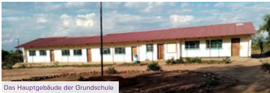
Das Hauptgebäude der Grundschule

Eine Fahrt zu den Viktoria-Wasserfällen führte sie zum ersten Mal zu der Grundschule, die damals von 40 Kindern besucht wurde und von einem einzigen Lehrer geführt wurde.