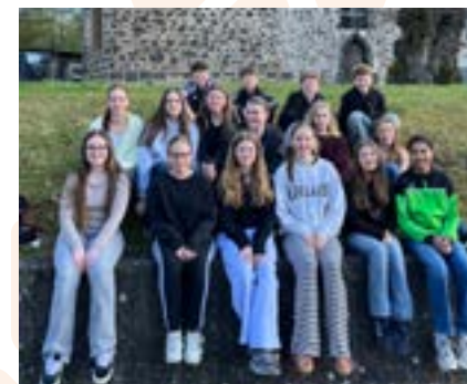
Gruppenbild der Gruppe 1, die dienstags in Watzenborn-Steinberg Konfiunterricht hatte