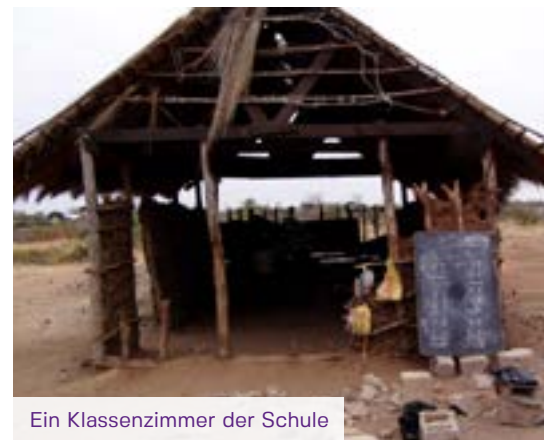
Ein Klassenzimmer der Schule

der letzten Zeit vermehrt zu Einbrüchen und Diebstählen gekommen, die erheblichen Schaden verursacht haben.