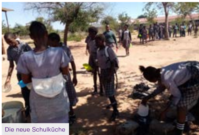
Die neue Schulküche

Dank dieser Unterstützung ist die Schule gewachsen. Zurzeit können knapp 1000 Schüler:innen von 20 Lehrer:innen betreut werden. Dieser Erfolg geht auch auf die vielen Menschen aus unserer