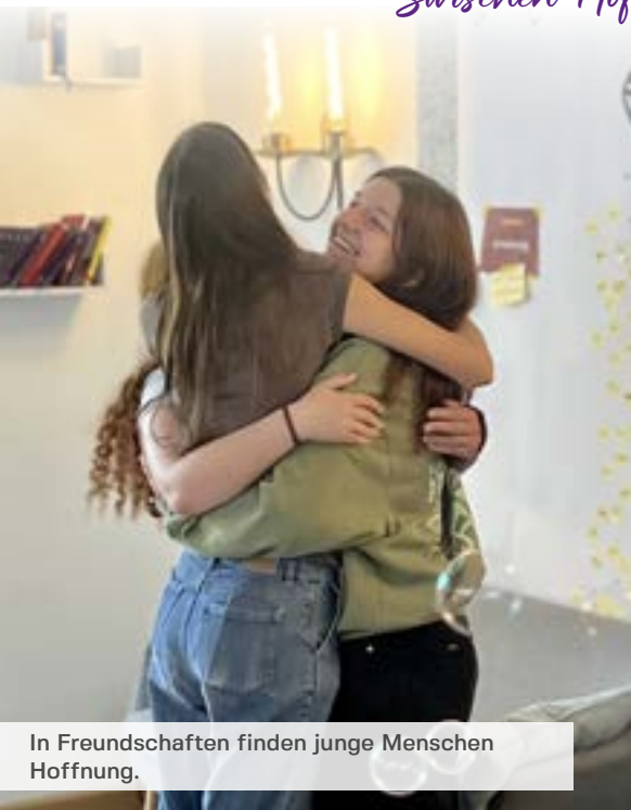
In Freundschaften finden junge Menschen Hoffnung.