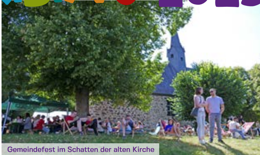
Gemeindefest im Schatten der alten Kirche

Ein großes Gemeindefest am Thomashaus in Watzenborn-Steinberg bildete den Abschluss der Kinderbibelwoche (KibiWo) im Nachbarschaftsraum am Schiffenberg.