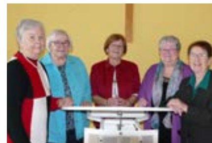
Der aktuelle Vorstand des Frauenkreises

Nun änderten sich auch die Aufgaben. Die Hilfen gingen über die Grenzen von Watzenborn-Steinberg hinaus. Der 1. Lima-Basar fand am 1. Advent 1971 im Thomashaus statt. Bis zum heutigen Tag unterstützen wir die Kinder in Lima.