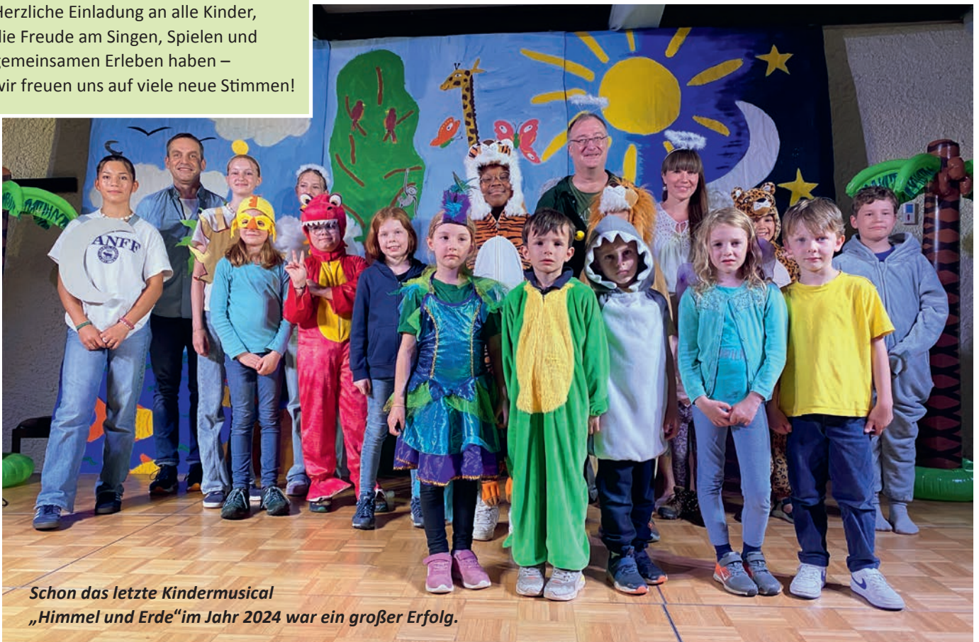
Schon das letzte Kindermusical „Himmel und Erde“ im Jahr 2024 war ein großer Erfolg.