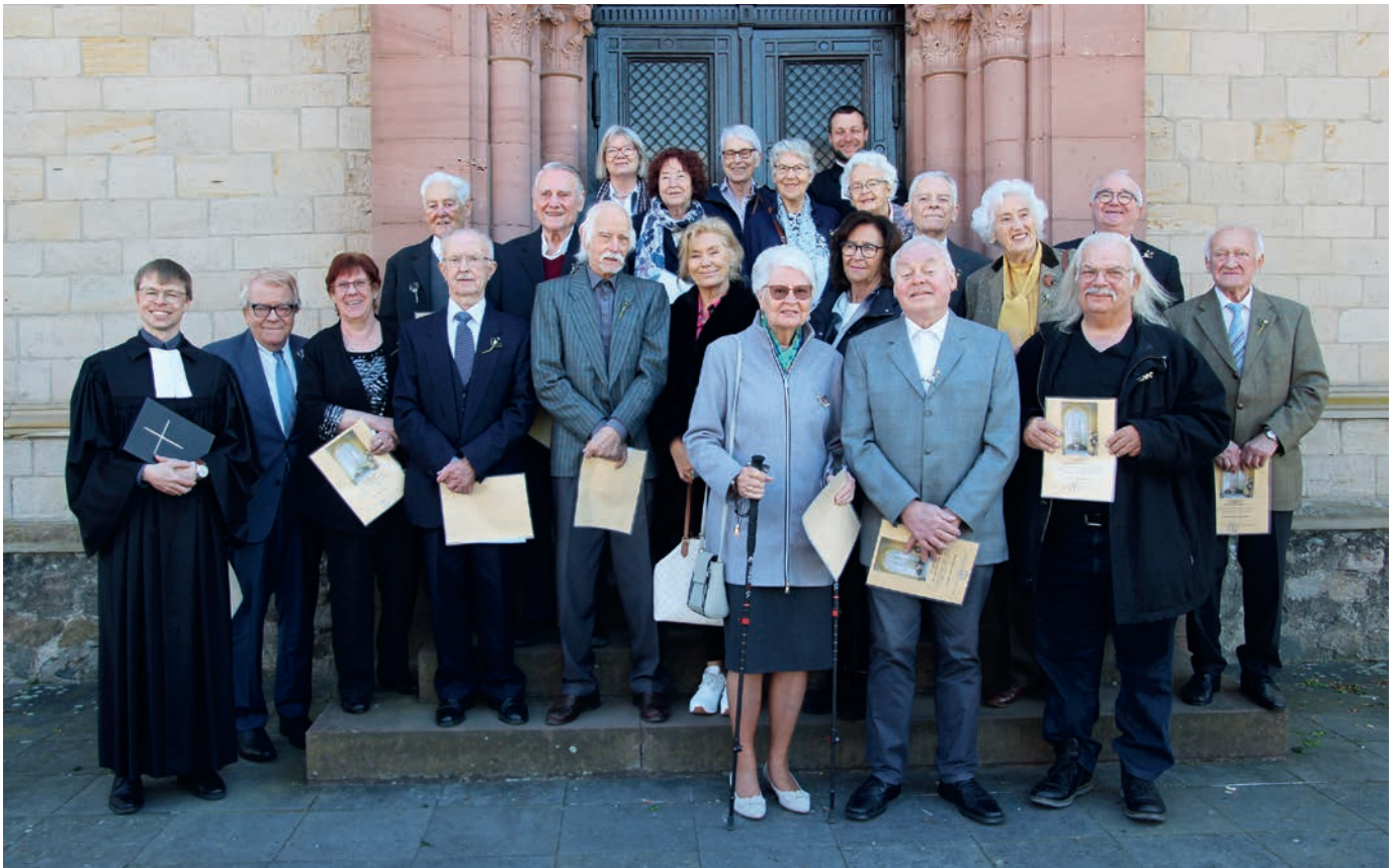
Am 6. April haben wir in einem festlichen Gottesdienst die Jubelkonfirmation gefeiert und danach gemeinsam Kaffee & Kuchen genossen. Auf dem Bild: Jubilare der Goldenen (Konfirmationsjahr 1975), Diamantenen (1965), Eisernen (1960), Gnadenen (1955) und Kronjuwelen (1950) Konfirmation!