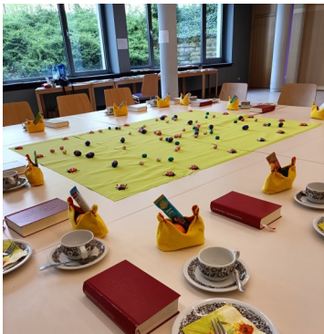
Spiele-Treff Verschiedene Karten- und Gesellschaftsspiele