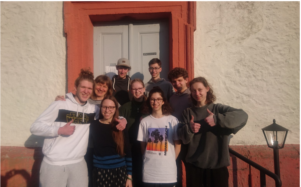
Das Freizeitteam beim Vorbereitungswochenende, Foto: Anke Weiß