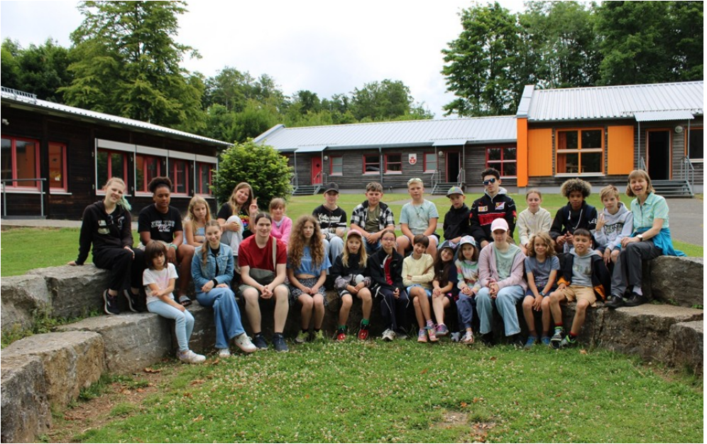
Fröhliche Kinderfreizeit in Ober-Seemen im Vogelsberg, Juli 2025