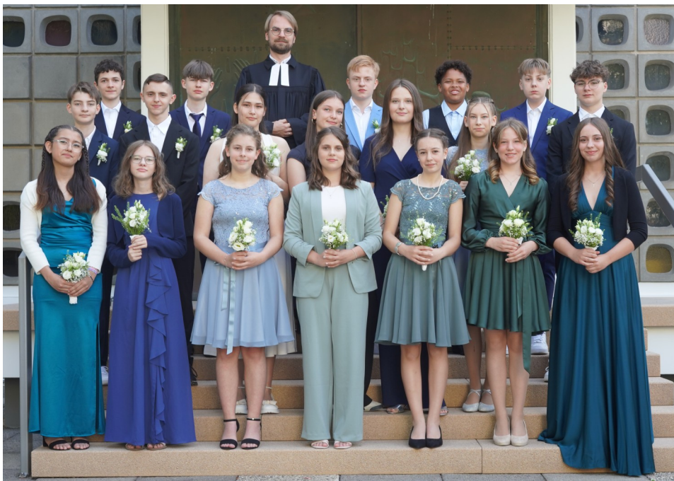
Konfirmation am 22. Juni in der Markus-Kirche