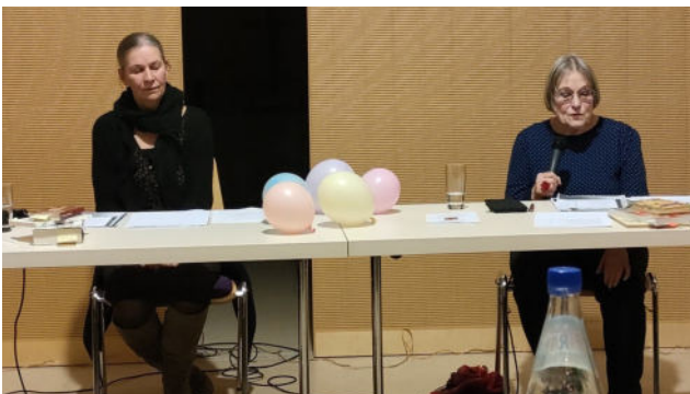
Literatur und Musik bei Wein und Kerzenschein am 26. Januar