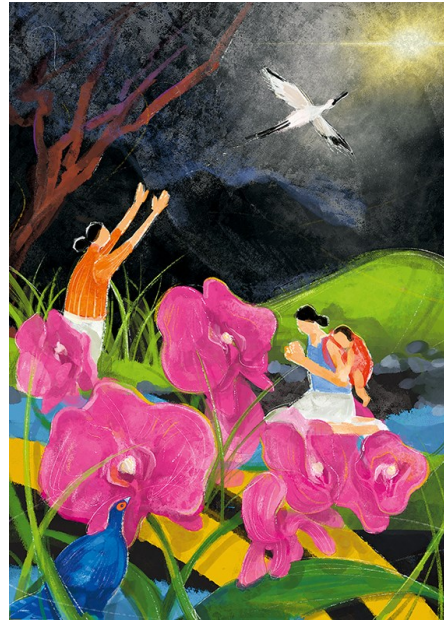
Hui-Wen Hsiao / © World Day of Prayer International Committee, Inc.

Im Anschluss noch Einladung zum Beisammensein am Feuer.