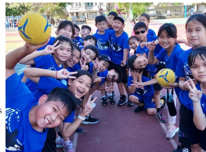
Schulkinder aus Taiwan

Katholische Gemeinden Hl. Dreifaltigkeit und St. Nikolaus Evang. Kirchengemeinden Bieber, Markus, Lukas- und Matthäus.