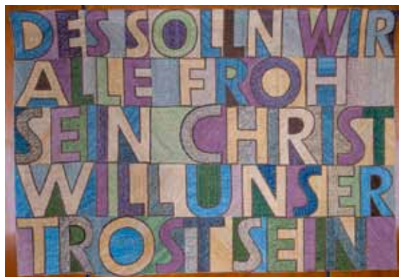
Linke Seite: Grundsteinurkunde mit Zeitkapsel, Schriftteppich Rechte Seite: Ausschnitt der Gedenktafel