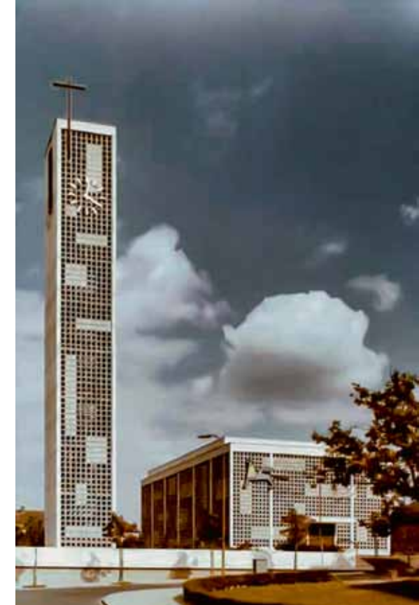
Historische Abbildung der Markus-Kirche aus dem Jahr 1961

trum. Die lichtdurchlässigen Wände stehen auch für die Transparenz, die der Mensch im Singen, Beten und im Hören auf die Heilige Schrift für die Gegenwart Gottes bekommen soll. Was im Inneren der Kirche verkündigt wird, soll nach außen strahlen: „Ihr seid das Licht der Welt!“ (Matthäus 5, 14).