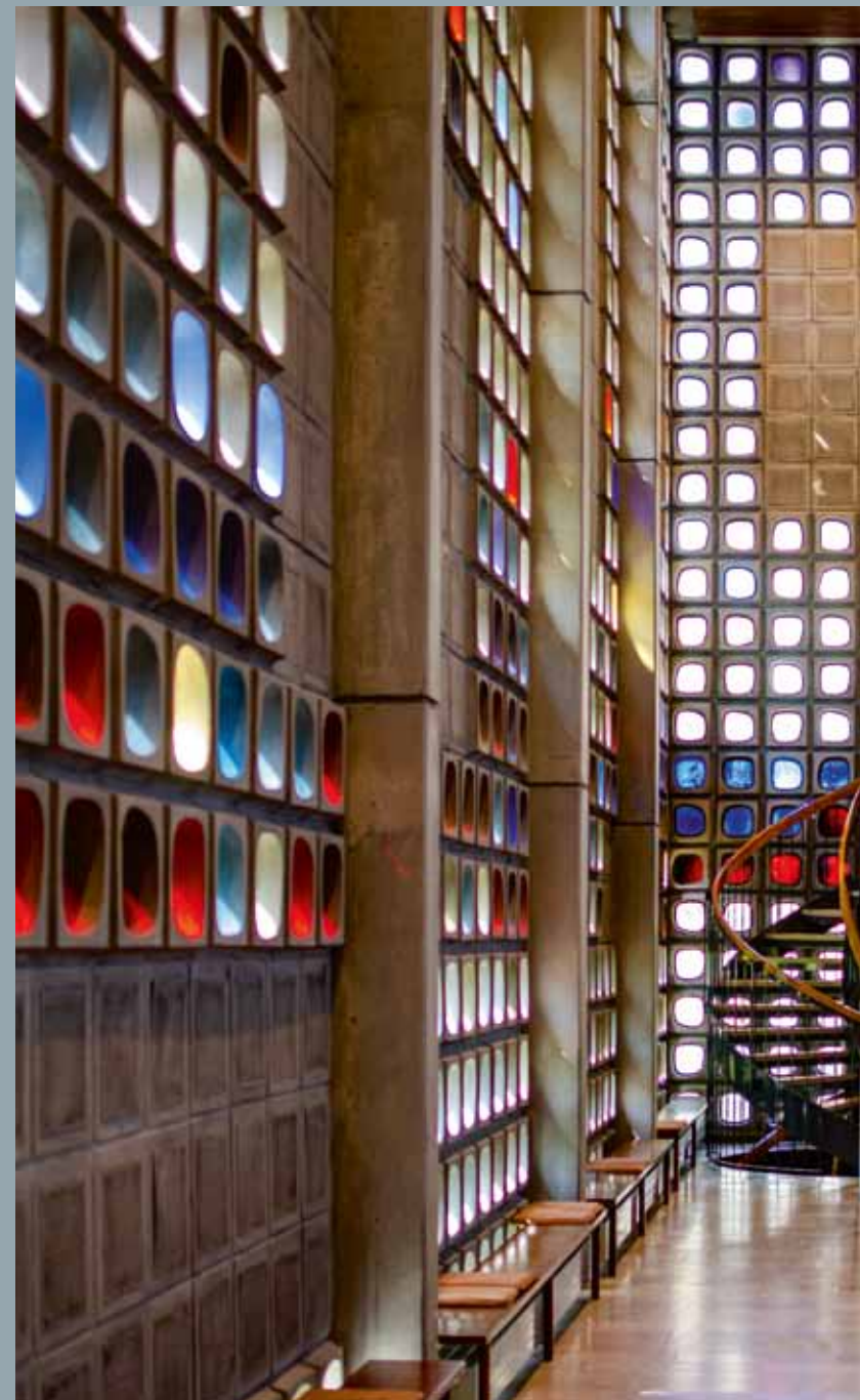
Eindrucksvoll leuchtende Glasfenster im Innenraum der Kirche

Die Markus-Kirche wurde auch als Konzert-Kirche konzipiert. Eine für damalige Zeiten ungewöhnliche Orgel lädt zu unterschiedlichen Konzerten ein. Der große Altarraum und die Empore bieten Platz für Chor und Orchester. Durch eine Tür getrennt, befinden sich neben der Kirche die Sakristei sowie ein Sitzungszimmer, das ursprünglich für den Kirchenvorstand geplant war und heute unterschiedliche Nutzung erfährt. Eine Wendeltreppe verbindet den Kirchenraum mit der Empore und der Unterkirche / Gemeindesaal. ■