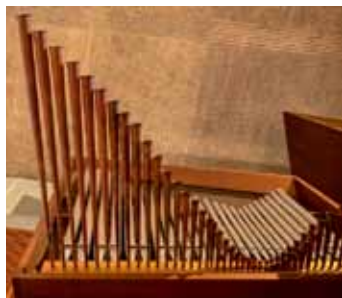
Spanische Trompete Orgelspieltisch