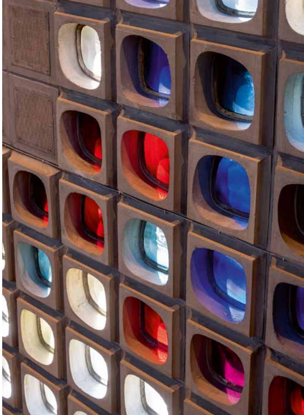
Ausschnitt der über 3200 farbigen Antikglasfenster