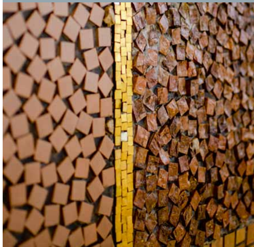
Detailaufnahme der Altarwand mit unterschiedlichen Mosaiksteinen