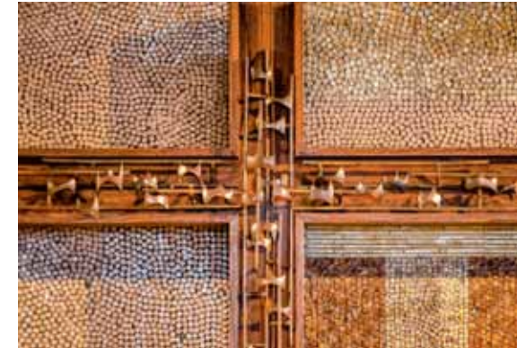
Altarwand Rechte Seite: Detailausschnitt des Kreuzes mit Dornen und Kronen Opferstock mit Inschrift: „Für unsere Kranken und Alten“ Taufbecken mit Inschrift: „Ich habe dich bei deinem Namen gerufen, du bist mein.“