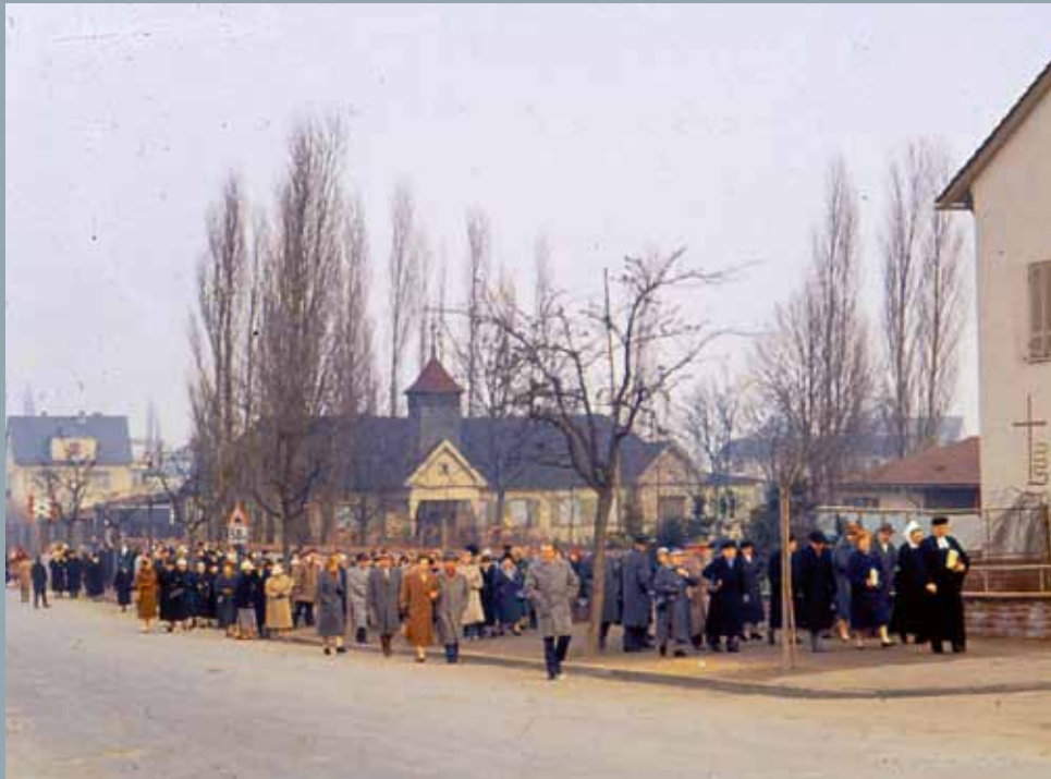
Linke Seite: Auszug aus der Kapelle im Jahre 1961. Rechte Seite: Altarkreuz und Altarleuchter