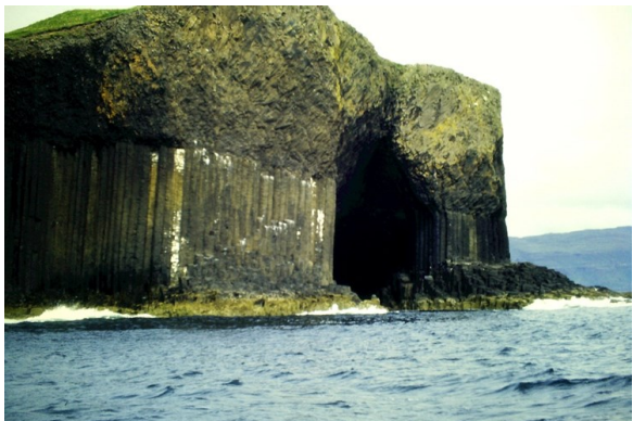
Fingal's Cave: Hebriden Insel Staffa

Schon Goethe war skeptisch, ob alle, die sich auf den Weg machen, dabei auch wirklich etwas mitbekommen, als er schrieb: „Um zu begreifen, dass der Himmel überall blau ist, braucht man nicht um die Welt zu reisen.“