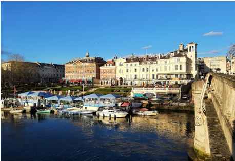
Richmond Bridge unter blauem Himmel

„Zuhause ist es am schönsten“ – das war mal! Aus Regionen unserer Welt, die wirtschaftlich weniger begünstigt sind, wo Kriege die vertraute Heimat zerstören, müssen nicht wenige Menschen aufbrechen, um ihr Zuhause notgedrungen zu verlassen. In den wohlhabenderen Teilen der Welt hat die Menschen eine andere Art der Rastlosigkeit erfasst. Ihr Motto lautet „Reisen bildet“. Klingt gut, hat Tradition, aber vielleicht doch nicht mehr! Der Engländer Laurence Sterne hat 1768 nach einer Italien-Reise mit seinem Werk „A Sentimental Journey“ (deutsch: Empfindsame Reise) die Idee des Reisens vom Kopf