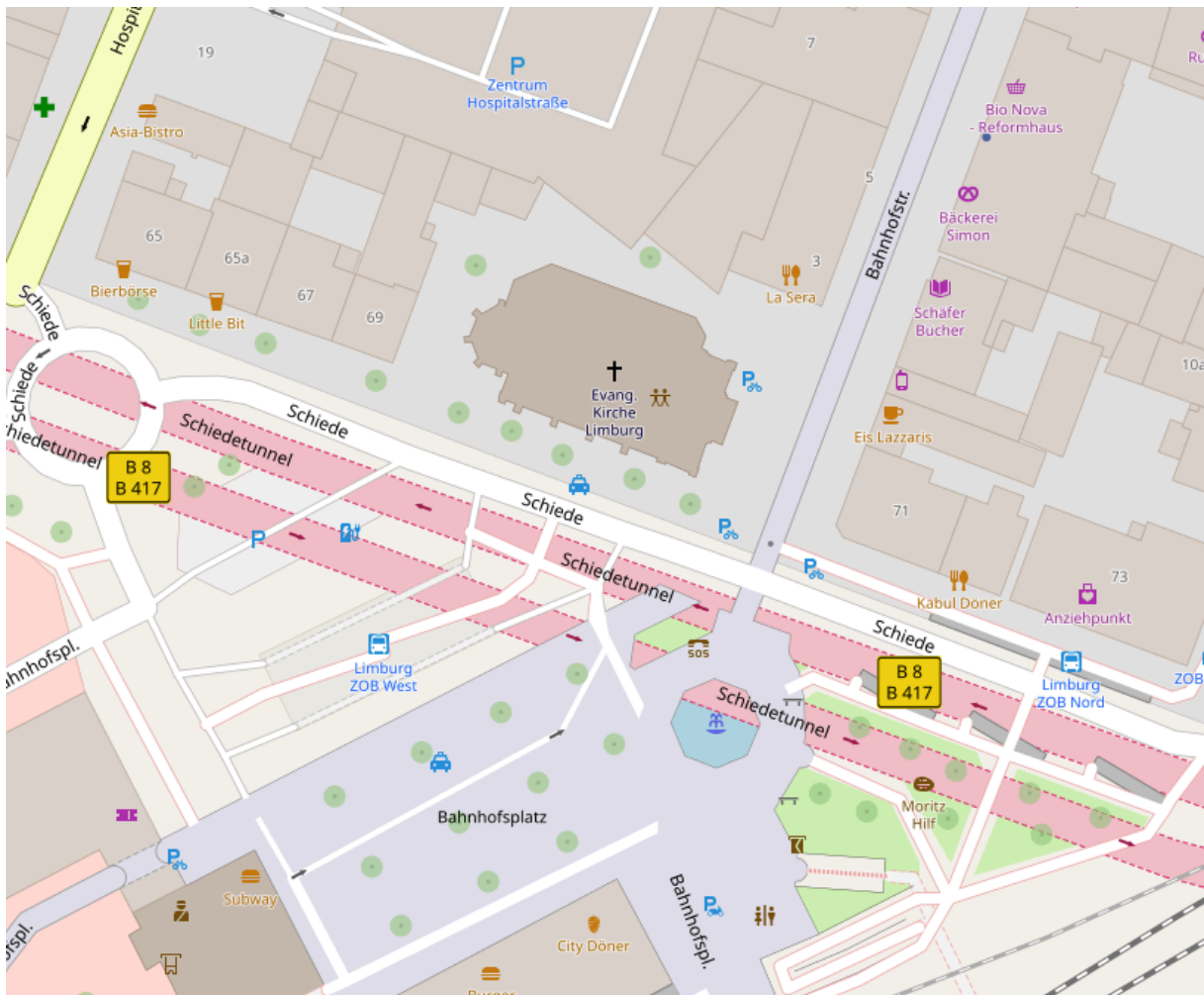
Openstreetmapauszug Limburg mit Fetze am Bahnhof

In der Stadt Limburg leben ca. 38.000, in Runkel ca. 10.000 und in Villmar ca. 7.000 Einwohner. Insgesamt sind davon ca. 9.000 (Stand 2018) evangelisch. Die religiöse Orientierung der Menschen in der Region ist stark ortsabhängig. Neben der Region Limburg, die deutlich katholisch geprägt ist, gibt es mit der Region Runkel auch Bereiche, in denen evangelische Christen in der Mehrheit sind. Dabei gibt es besonders in der Kreisstadt Limburg viele nicht- oder andersgläubige Menschen.