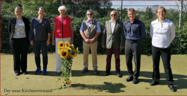
Der neue Kirchenvorstand