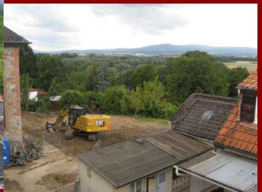
Bilder Pfarrhausabbruch H.H. Müller