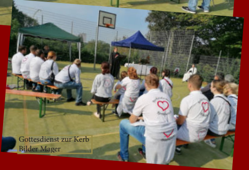
Gottesdienst zur Kerb Bilder Mager