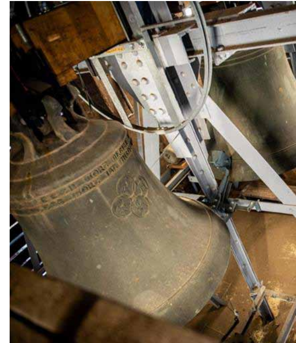
Im Glockenturm der Dreikönigskirche

Auch auf dem Weg zum Gottesdienst begleiten sie uns: 30 Minuten vor Beginn erfolgt der erste Ruf, bevor sie ihn zehn Minuten vor Beginn für zehn Minuten festlich einläuten.