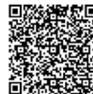
Turmbesteigung 19 Uhr