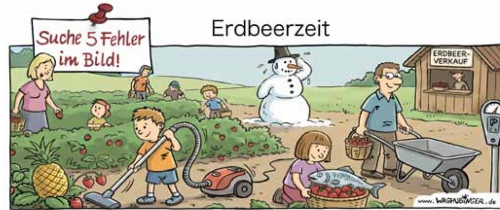
Ananas, Staubsauger, Schneemann, Schneemann, Fisch, Parkuhr