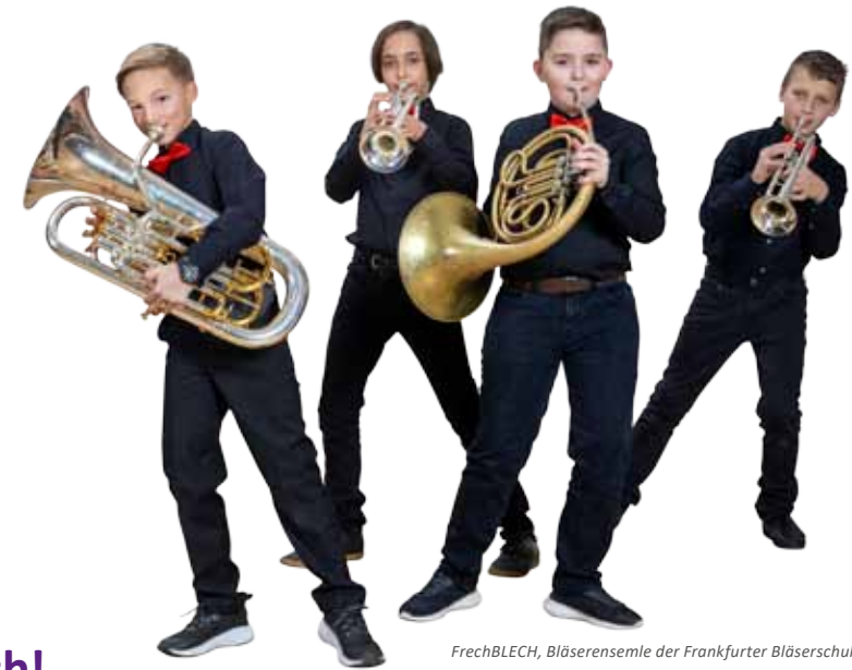
FrechBLECH, Bläserensemble der Frankfurter Bläuerschule

Förderverein für Kirchenmusik in der Dreikönigskirche »Kirchenmusik Dreikönig e.V.« Spenden erbeten, Konto Postbank Frankfurt (M), IBAN: DE63 5001 0060 0653 1336 09 Spenden sind steuerlich absetzbar; eine Zuwendungsbestätigung wird bei Angabe von Name und Anschrift gerne ausgestellt.