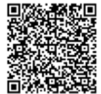
Turmbesteigung 18 Uhr