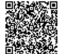
Turmbesteigung 21 Uhr