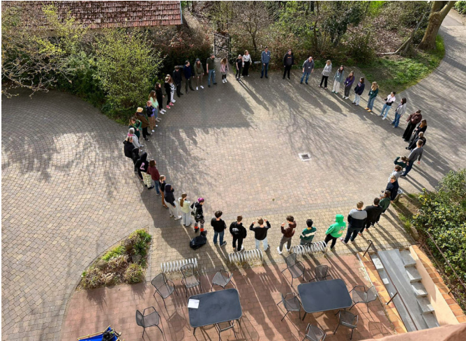
JuLeiCa-Schulung des Dekanats Bergstraße in den Osterferien

Ja, den „Schnoodle“ gibt es: Eine Kreuzung zwischen Riesenschmauzer und Pudel, eingesetzt als Assistenz- und Rettungshund! Hätten Sie's gewusst?