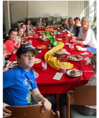
Geschichten- frühstück in Medenbach