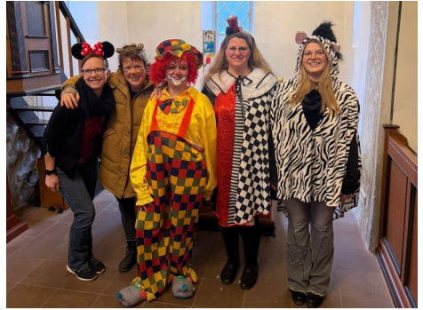
Fastnachtsfamiliengottesdienst in Auringen