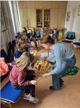
Weltgebets- tag für Kinder 2026: Nami- bia