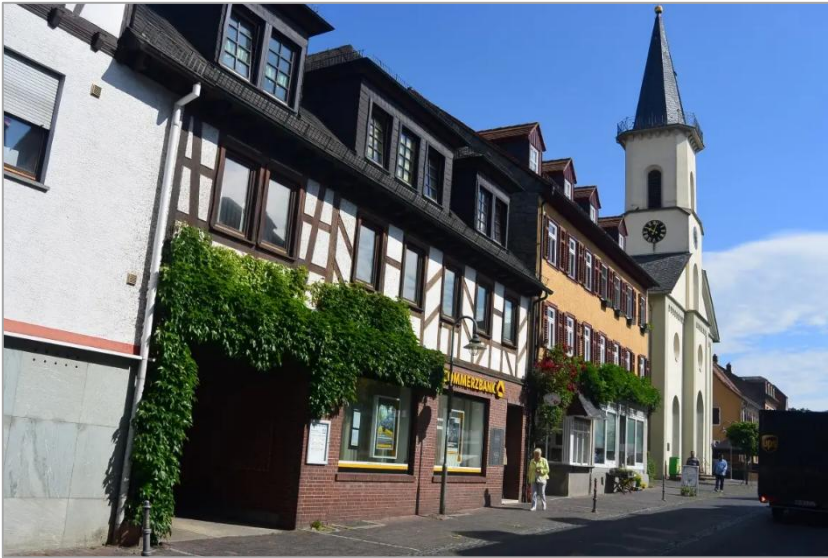
Attraktives Ziel und S-Bahn-Endstation: Friedrichsdorf im Taunus! Hier die Hugenottenstraße mit der Kirche.

Am 30. August fährt eine kleine Gruppe aus der Französisch- Reformierten Gemeinde Offenbach nach Friedrichsdorf, eine Neugründung für hugenottische Glaubensflüchtlinge in der früheren Landgrafschaft Hessen-Homburg. Nach dem 10-Uhr-Gottesdienst in der Herrnstraße steigen die Teilnehmenden direkt in die unter der Kirche gelegene S-Bahn-Station OF-Marktplatz, um eine gute \frac{3}{4} Stunde später in Friedrichsdorf zum Mittagessen im "Restaurant Hugenottengarten" begrüßt zu werden. Das Sonntagsprogramm geht weiter mit einer Stadtführung, auch ein Besuch des Philipp-Reis-Museums ist geplant. Dieses Museum nimmt besonders die hugenottische Geschichte von Friedrichsdorf in den Blick.