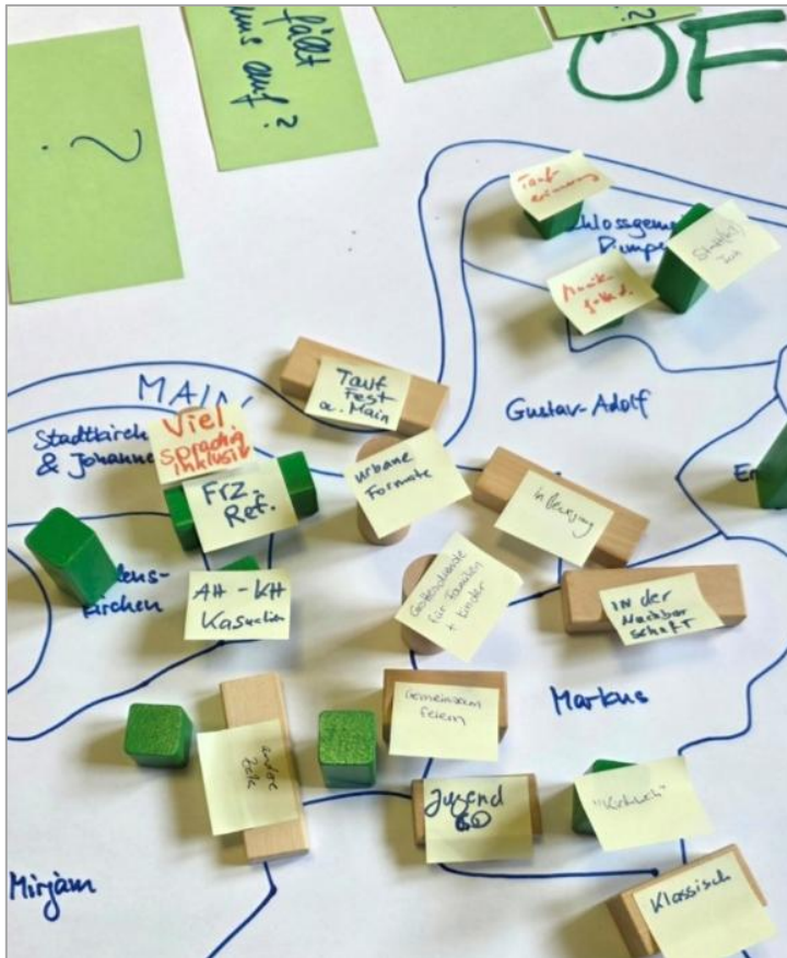
Wo werden künftig noch Gottesdienste gefeiert? Planspiel in kirchlichen Entscheidungsgremien im Stadtdekanat Frankfurt und Offenbach.

in großflächigen Gemeinden widerstehen. Hier verwirklicht sich „Kirche für und mit anderen“, wie Bonhoeffer sie ersehnt. Im Gegenzug zu immer großflächigeren und an Anonymität zunehmenden kirchlichen Räumen, durch die der Abwärtstrend der Kirche nur noch beschleunigt wird, ist die FRGO1699 eine ökumenisch offene „Migrations- und Freiwilligkeits-Kirche“, wo eine präsenste Pfarrperson gemeinsam mit Presbyterium und Diakonie den einzelnen Menschen die Treue hält und verlässlich allsonntäglich das Evangelium in Wort und an besonderen Tagen mit Taufe und Abendmahl bezeugt, sowie durch die helfende Tat. Ihr Gesicht gewinnt sie in den vielfältigen, inklusiven Gottesdiensten für Groß und Klein, ihren Klang in den Genfer Psalmen und Gesängen in der franz.-ref. Kirchenmusik. Mundpropaganda leisten Gruppen und Initiativkreise. Aktionen, von der geöffneten Kirche bis zu Besuchen bei Älteren oder Kranken, werben um Aufmerksamkeit werben für Gottes heilsame Gegenwart.