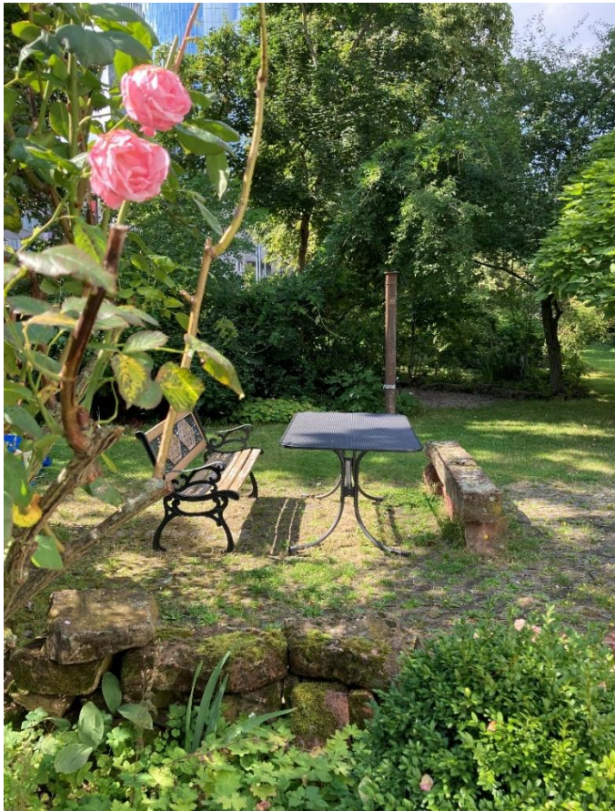
Pfarrgarten im Frühling

Das Treffen findet nach den hessischen Herbstferien am Samstag, den 24. Oktober statt.