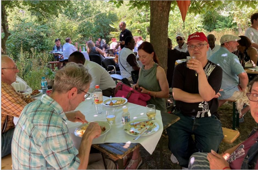
Sommerfest in der Oase des jahrhundertealten Pfarrgartens.