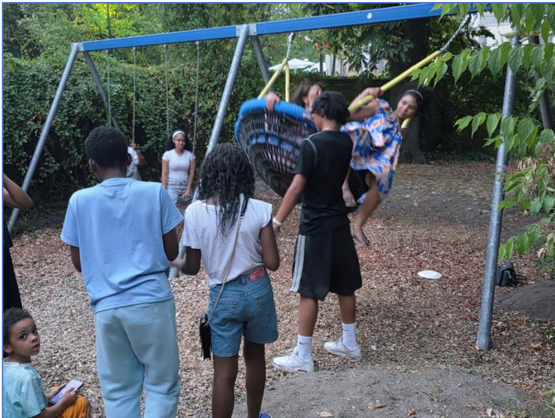
Attraktion für die Jugend bei jedem (Sommer)Fest: Die Schaukeln und das Schaukelnest im Pfarrgarten. Hier bei der Grillparty Nkul' Beti.