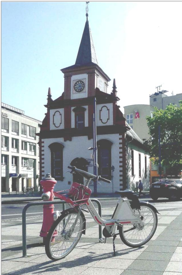
Oase in Mitten der turbulenten Stadt Offenbach: Die Franz.-Ref. Kirche, ein Wahrzeichen und lebendiges Denkmal.

Die Kirche ist von 9-12 Uhr und von 14.30-15.30 Uhr geöffnet. Führungen um 11 Uhr für Groß und Klein und um 15 Uhr.