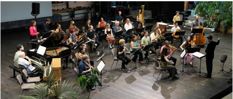
Abschluss-Konzert der Young Ensemble Academy im Jahr 2024

Französisch-Reformierten Kirche, Offenbach Donnerstag, 20. August, Beginn 19 Uhr, Einlass 18:30 Uhr