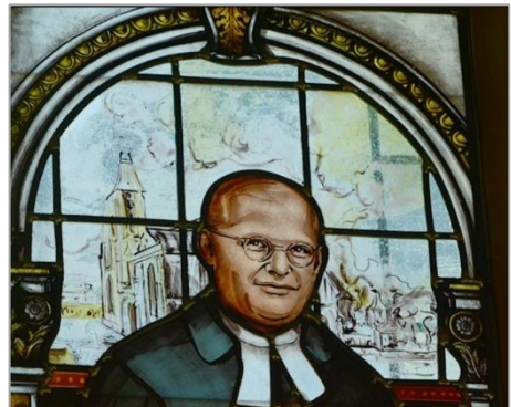
Pastor Dr. Dietrich Bonhoeffer (1906-1945), Theologe und Märtyrer der ‚Bekennenden Kirche‘, hier in einem Kirchenfenster von St. Christophorus in seiner Heimatstadt Breslau.

Eine regelrechte Depression greift heute in der evangelischen wie in der katholischen Kirche um sich. Äußerlich machen Skandale um sexuelle Gewalt den Kirchen zu schaffen; innerlich führen eine große Gleichgültigkeit und Gottvergessenheit der Menschen in beiden Kirchen seit Jahren zu einer massenhaften Kirchenaustrittswelle. Es steht alles zur Disposition. Kirchliche Gebäude sollen abgestoßen und verkauft werden. Die Wohnortgemeinde mit einem abgegrenzten Straßengebiet in einem Stadtteil als Modell einer überschaubaren „Kirche der kurzen Wege“ soll abgeschafft werden zugunsten von „Nachbarschaftsräumen“, laut ekhn2030.