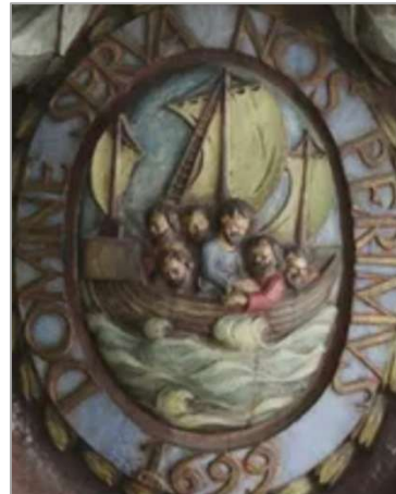
Ein Schiff in Gefahr: Wappen der Französisch-Reformierten Gemeinde Offenbach am Main 1699.