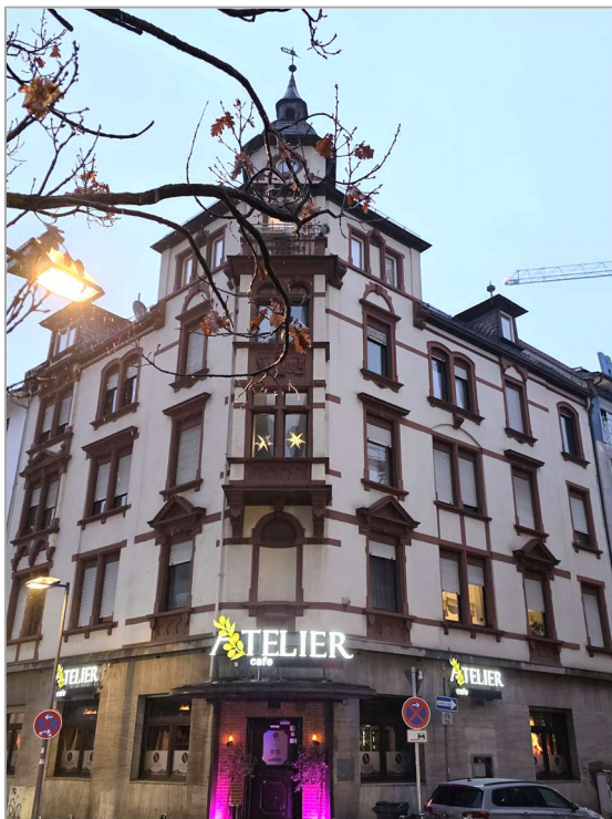
Belle Époque á Offenbach, Schlosstraße Ecke Ziegelstraße

Der Wettbewerb ist zwar abgeschlossen, aber weitere Motive "Französisches in Offenbach" veröffentlichen wir gerne noch, wie z.B. dieses Motiv eines Mitglieds des Redaktionskreises, das daher nicht mit in gewertet und prämiert werden konnte: