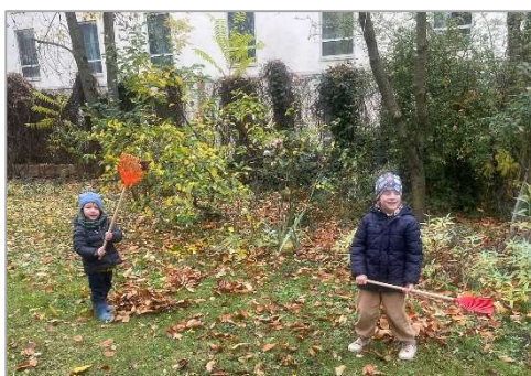
Kleine Helfer sind willkommen! Impressionen von einem Gartentag im vergangenen Jahr

Alle hoffen, dass es am 9. Mai nicht regnet! Obwohl Mairegen ja Segen bringt! Denn an dem Samstag soll wieder ein Gartentag im französisch-reformierten Pfarrgarten steigen!