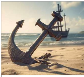
Ein Ankerkreuz am Strand. Im Hintergrund ein Schiff, ähnlich dem im Wappen der FRGO1699.

Als Symbol, Siegel und Wappen wählten die Gründerinnen und Gründer der Französisch-Reformierten Gemeinde Offenbach ein Schiff, das beinahe untergeht. Sie hatten die Hoffnung, dass ihre basisdemokratische Gemeinde-Ordnung, ihr calvinistisches Bekenntnis, ihr gelebtes biblisch inspiriertes Christentum in Offenbach, damals mehrheitlich deutsch-reformiert, nicht untergeht, sondern eine Zukunft hat. Sie hofften, hier einen Ankerplatz zu finden. Sie kannten das Hugenotten-Kreuz.