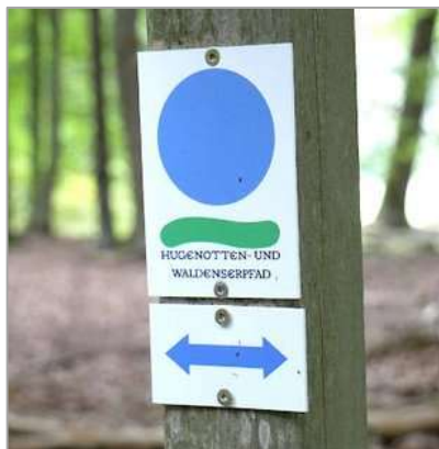
Das Logo des Hugenotten- und Waldenser-Pfades ist gleichzeitig auch das Wanderzeichen, das Orientierung gibt beim Pilgern.

28. Juni: Sonntagsspaziergang nach dem 10-Uhr-Gottesdienst