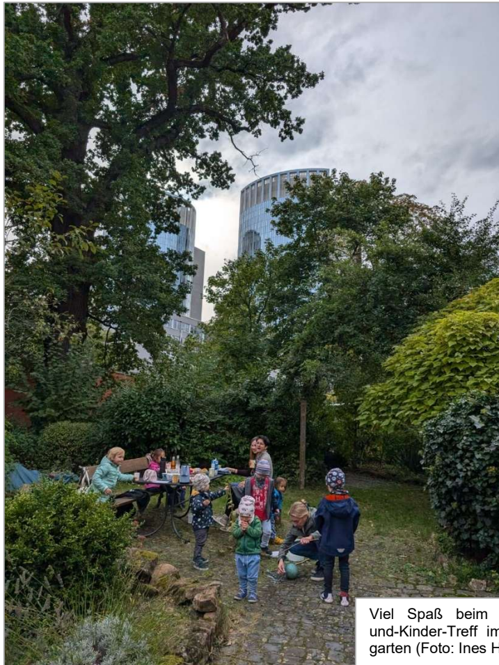
Viel Spaß beim Mütter- und-Kinder-Treff im Pfarrgarten

Im Saal und im Pfarrgarten der Französisch-Reformierten Gemeinde treffen sich regelmäßig Mütter und ihre Kinder, die aktuell die Evangelische Kindertagesstätte im Zion, an der Schlosskirche, Arthur-Zitscher-Straße, besuchen. Die Treffen werden ehrenamtlich begleitet und sind Teil des Gemeindelebens. Dazu gehören auch die religionspädagogischen Impulse und die begleitenden Angebote von Pfarrer Schneider-Trotier, die diese Treffen sinnvoll ergänzen. Die Treffen dienen dem gemeinsamen Austausch der Familien und dem Hineinwachsen in eine Gemeinschaft.