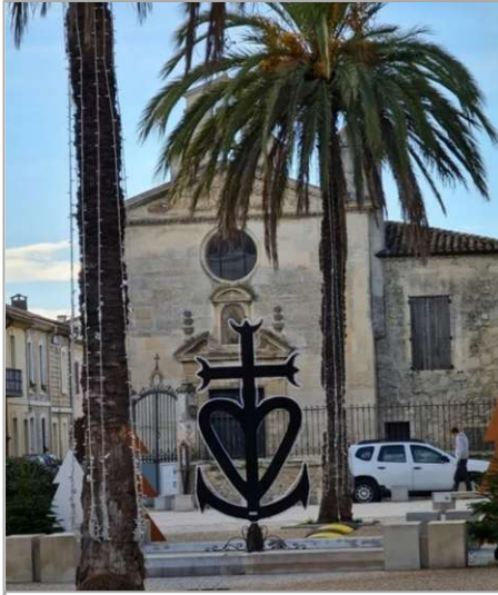
Camargue-Kreuz vor der Kirche Saintes-Maries-de-la-Mer in der Camargue, Südfrankreich.

Die drei oberen Enden des Kreuzes sind häufig dreizackig. Die Dreizähne waren die Werkzeuge der Gardians, d. h. der Camargue-Viehzüchter, um die in der Wildnis gezüchtete Tiere zu bewegen. Genau aus diesem Grund wird das Camargue-Kreuz auch als Wächterkreuz bezeichnet – "croix gardiane" auf Französisch.