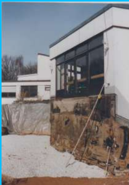
...und während des Kindergarten-Anbaus 2001