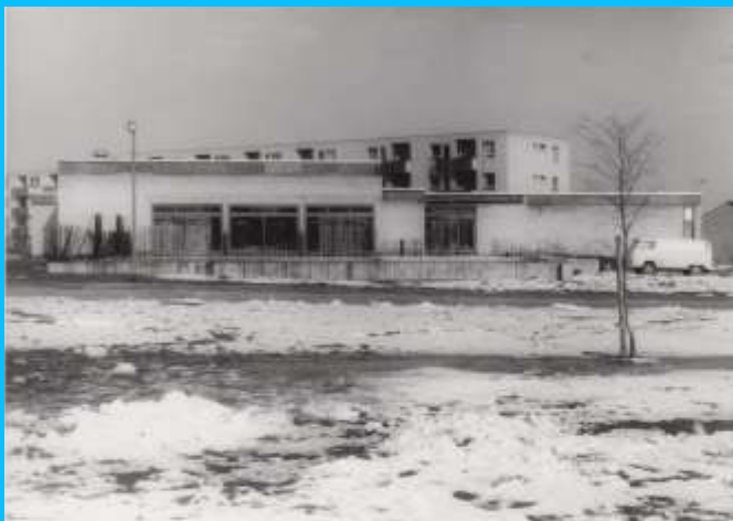
Das Gemeindehaus der Limesgemeinde ca. 1970...