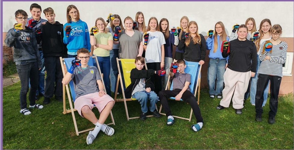
Foto: Konfirmandinnen und Konfirmanden aus Wald-Michelbach und Siedelsbrunn