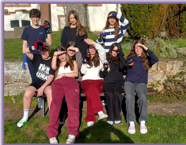
Foto: Konfirmandinnen und Konfirmanden aus Hammelbach

Konfirmation mit Abendmahl am Sonntag, 10. Mai 2026 um 10.00 Uhr