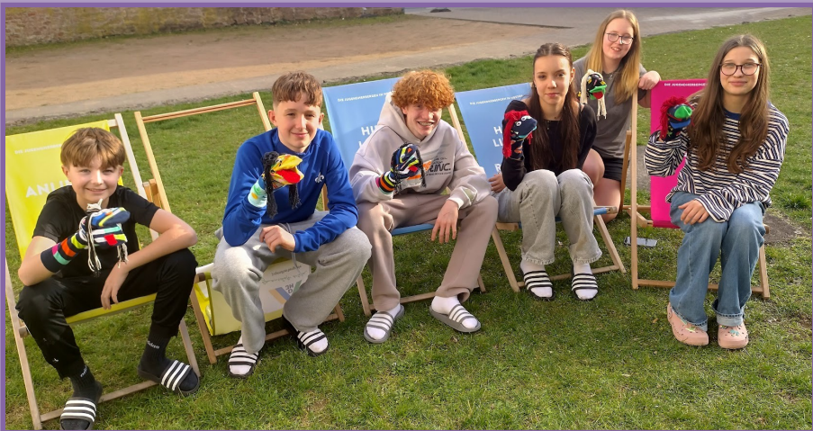
Foto: Konfirmandinnen und Konfirmanden aus Affolterbach

Konfirmation mit Abendmahl am Sonntag 31. Mai 2026 um 10.00 Uhr