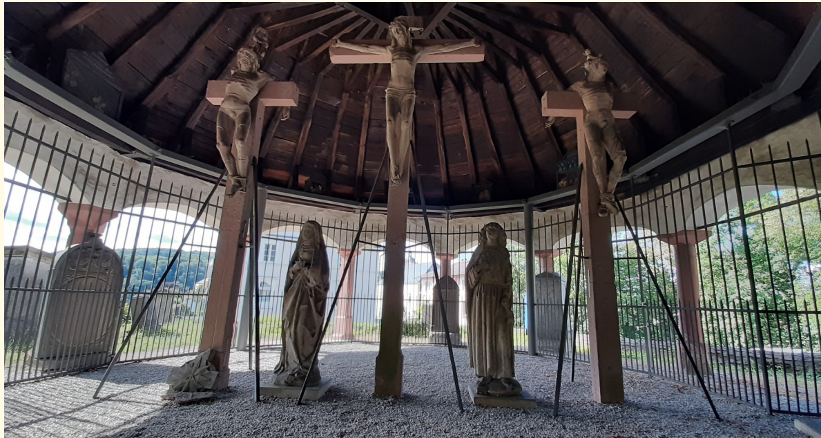
Figurengruppe auf dem Kalvarienberg—16. Jahrhundert.

Die beiden Verbrecher stellen auch den Betrachter heute vor die Frage: Auf welche Seite stelle ich mich? Wie will ich mein Leben gestalten?