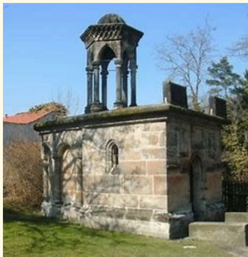
Im Vergleich: Oben die Heilig-Grab-Kapelle in Görlitz, unten die in Weilburg.

Denn die Nachbildungen des Heiligen Grabes spiegeln jeweils die Erinnerungen ihrer zumeist fürstlichen Auftraggeber an ihre eigene Pilgerfahrt zu den Heiligen Stätten in Jerusalem.