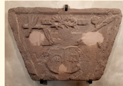
Reliefstein von 1582.

Von besonderer Bedeutung ist auch ein Reliefstein von 1581, der - entsprechend seiner Trapezform - ursprünglich wohl als Schlussstein eines Portals in der Außenmauer diente. Er zeigt die Marterinstrumente des Karfreitag: Dornenkrone, Geißel, Ruten, Lanze und Essigschwamm, darunter ein Wappenschild der Stifter des Steins oder Portals. Solche Steine markierten oft das Ende eines Passionsweges. Er könnte also ein Beleg sein für die oben beschriebenen Prozessionen.