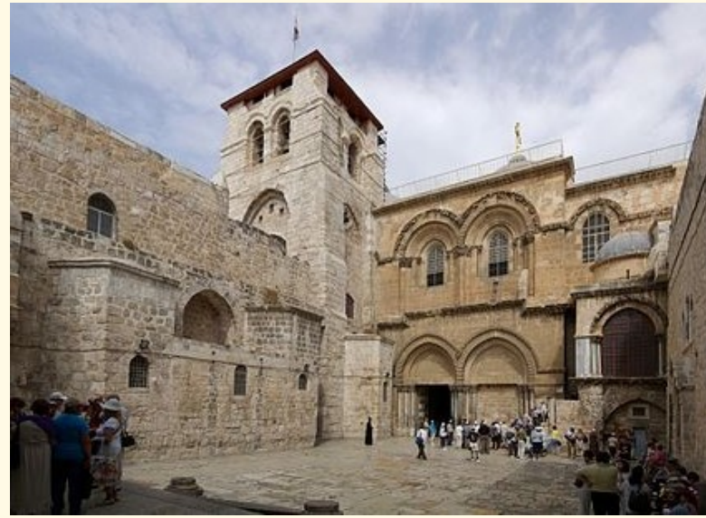
Seit Jahrhunderten ein Ort für Pilger: Die Grabeskirche in Jerusalem.

Der römische Kaiser Konstantin—Er sorgte für den Aufbau der Grabeskirche in Jerusalem.