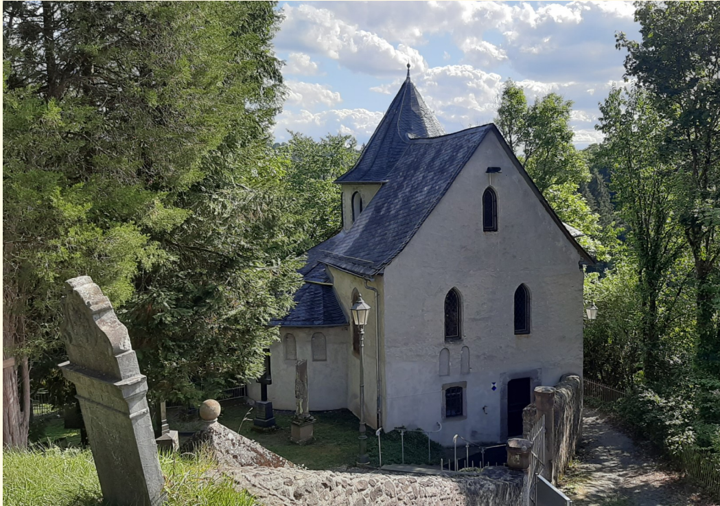
Blick vom Kalvarienberg auf die Heilig-Grab-Kapelle.

Damit verbunden war eine Renovierung, aber auch der Verlust alter Bausubstanz. Die unterirdische Gruft liegt unter dem Grabstein des Freiherrn Friedrich Heinrich von Dungen und seiner Frau—im Eingangsbereich der Kirche.