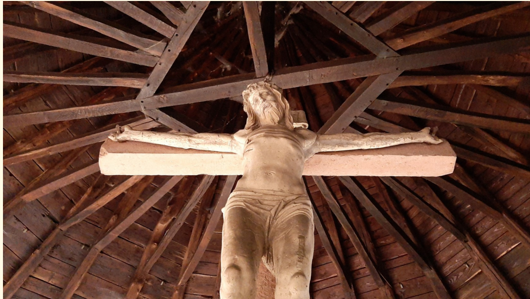
Darstellung des Gekreuzigten auf dem Kalvarienberg

Sie wurden auf dem Dachboden der Kapelle gefunden und hier nach ihrer Restaurierung aufgestellt. Es sind Gedächtnischreine, die Totenkronen oder andere Erinnerungszeichen an geliebte, verstorbene Personen enthalten. Ursprünglich stellten Angehörige sie im heimischen Bereich auf.