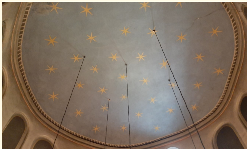
Oben: Sternenhimmel im Gewölbe; unten: Blick auf den Altarbereich.

Links vom Altar steht ein Taufstein aus Marmor. Er wurde in der Neuzeit gefertigt.