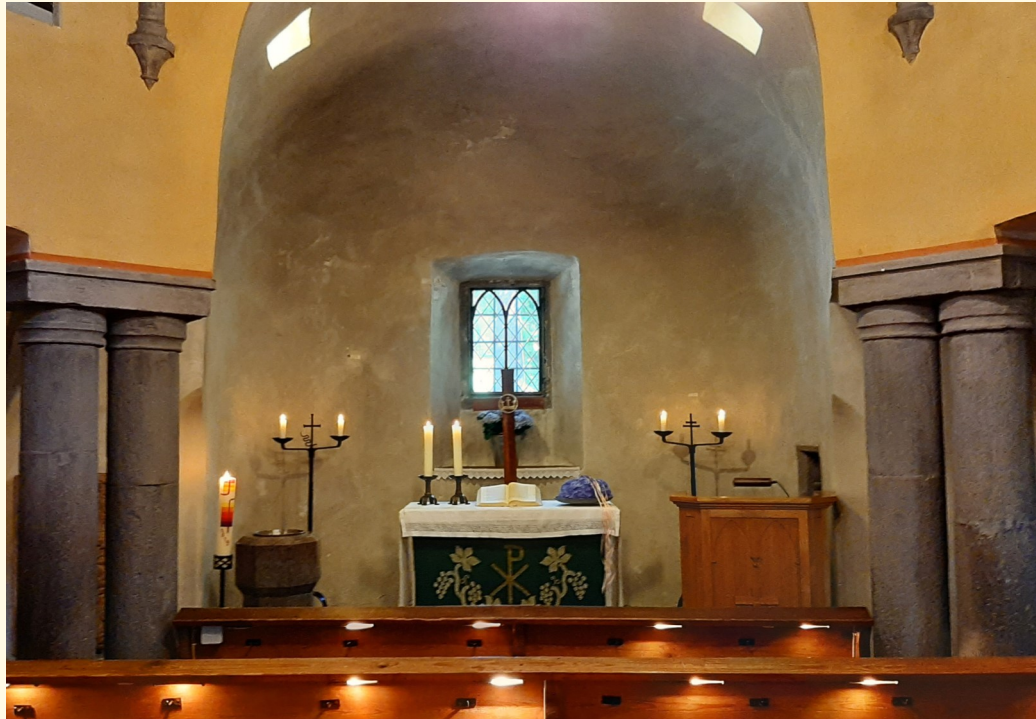
Blick auf den Altarraum in der Heilig-Grab-Kapelle.

Die alten Steine erzählen eine zeitlose Botschaft. Hier lässt sich dem Evangelium von Jesus Christus mit Augen und Herzen nachspüren: Jesus ist gestorben und auferstanden. In ihm bleibt Gott an unserer Seite – für alle Zeit.