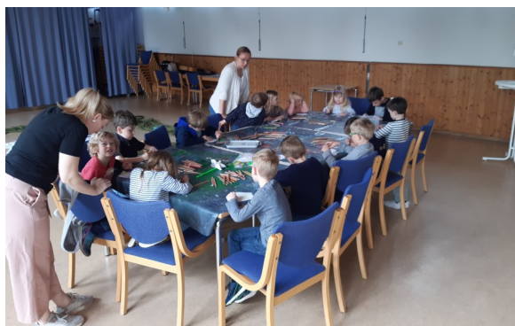
... zum Thema "Pfingsten"