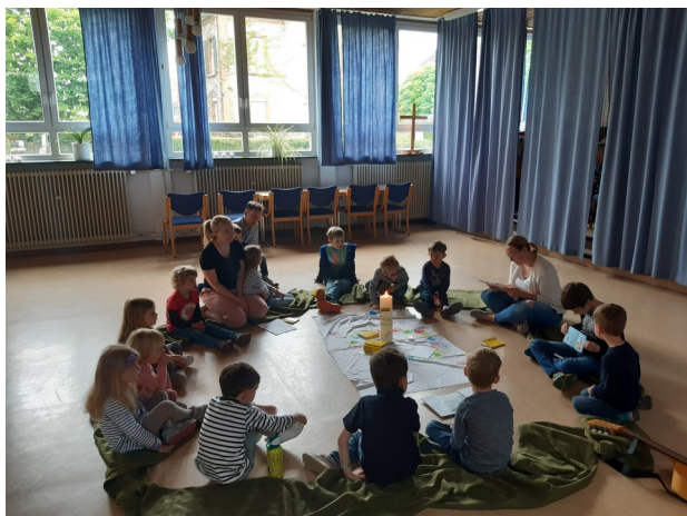
Kindergottesdienst am 7. Mai ...