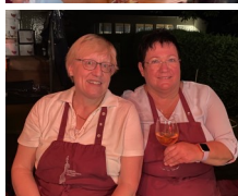
am Cocktailstand der Ev. Kirchengemeinde Götzenhain