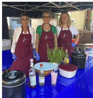
Dorfbrunnenfest am 25. und 26. Juni