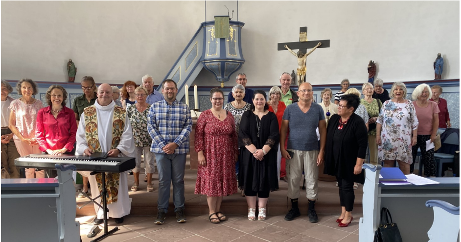
Ökumenischer Gottesdienst am 26. Juni