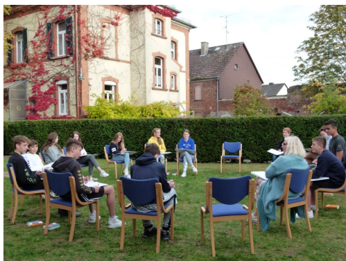
Lehrgang der Konfirmandinnen und Konfirmanden im Gemeindehaus