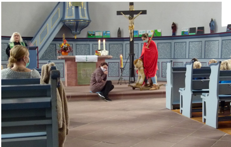
St. Martins-Gottesdienst der Kita-Kinder