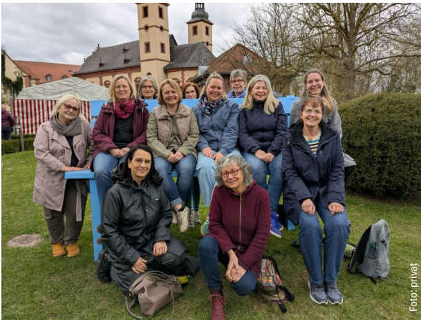
≧ Gruppenbild: Die Atempause vor (kl)österlicher Kulisse

Wir erinnerten uns an das letzte Mahl Jesu, konnten ein menschengroßes Kreuz tragen und stiegen in die dunkelsten Kellerräume des Klosters und zum Schluss dekorierten wir im Innenhof des Klosters einen Osterkranz mit Osterglocken.