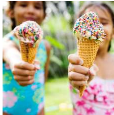
Das Titelbild zeigt die Skulptur „Die Froschkönigin“ der Wiesbadener Künstlerin Birgid Helmy am Biebricher Rheinufer. Foto: Robert Belz / Das Bild auf der Rückseite zeigt die Abendmahlskanne der Ev. Hauptkirche Foto: Thomas Krenski