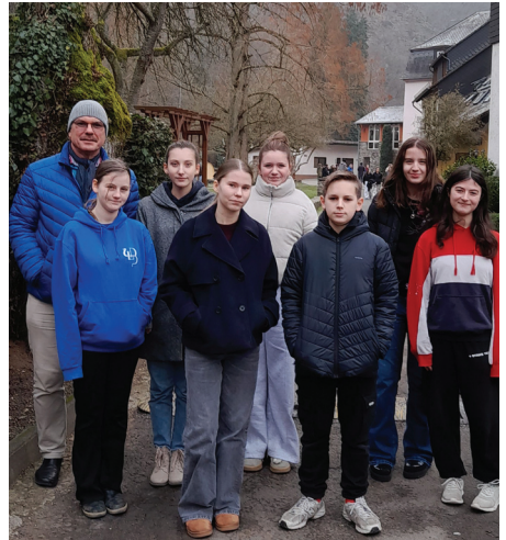
Hier sieht man die Konfirmandinnen und Konfirmanden vor der Klostermühle.

An diesem Abend wollen wir einander kennenlernen und auch einen Einblick in die Jahresplanung der Aktionen und des Unterrichtes gewäh-