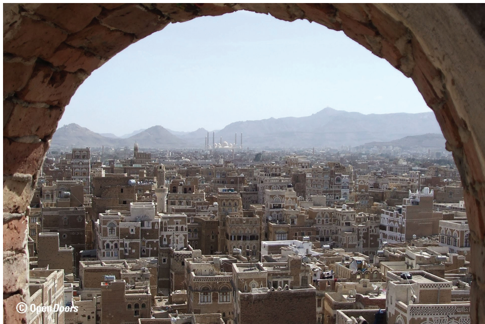
Blick über die jemenitische Hauptstadt Sanaa

Bitte beten Sie für die Christen im Jemen!