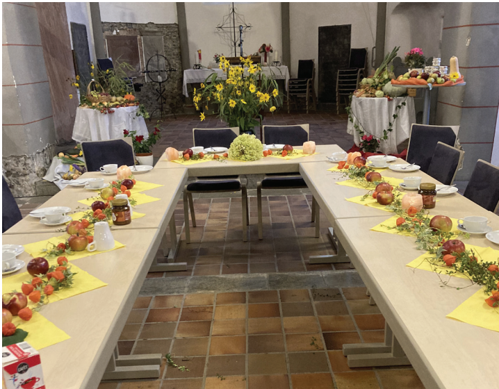
Ein Bild von unserer festlich geschmückten Tafel.