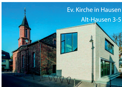
Ev. Kirche in Hausen Alt-Hausen 3-5