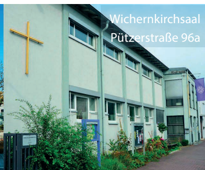
Wichernkirchsaal Pützerstraße 96a