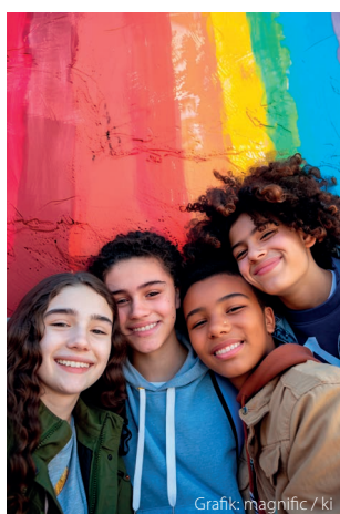
Grafik: magnific / ki