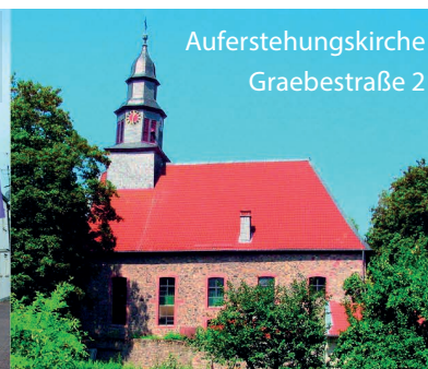
Auferstehungskirche Graebestraße 2