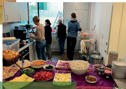
Frühstück für Alle