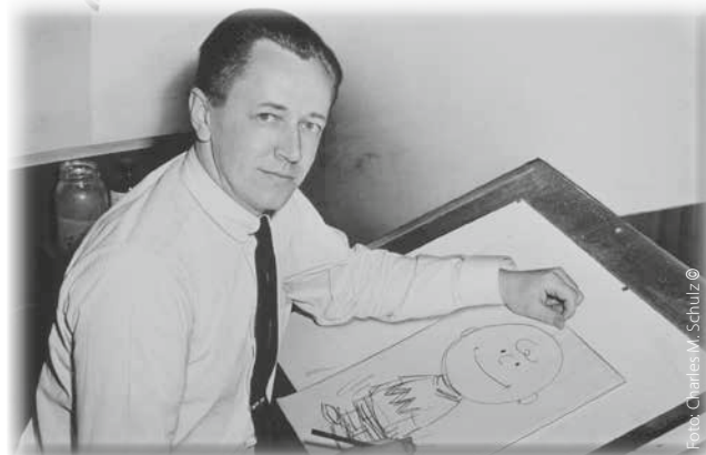
Foto: Charles M. Schulz

Snoopy & Lucy, Charlie Brown & Peppermint Patty – die Peanuts kennen alle Kleinen und Großen – und wir lieben sie! Der Zeichner der Peanuts, Charles M. Schulz, würde in diesem Jahr seinen 100. Geburtstag feiern. Wir feiern mit, und zwar in der Sommerkirche der Lydiagemeinde!