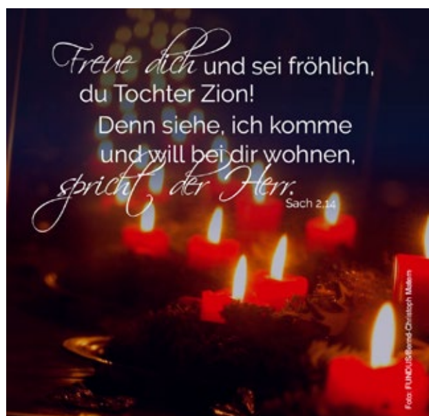
Monatsspruch Dezember 2021