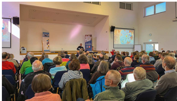
Eindrücke der bisherigen Impuls- und Begegnungstage.

Die besondere Atmosphäre in der Komturkirche lädt zum persönlichen Gebet und zu Zeit in der Stille ein.