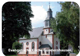
Evangelische Kirche Gundernhausen