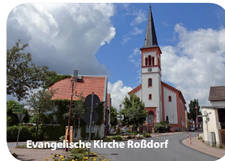
Evangelische Kirche Roßdorf