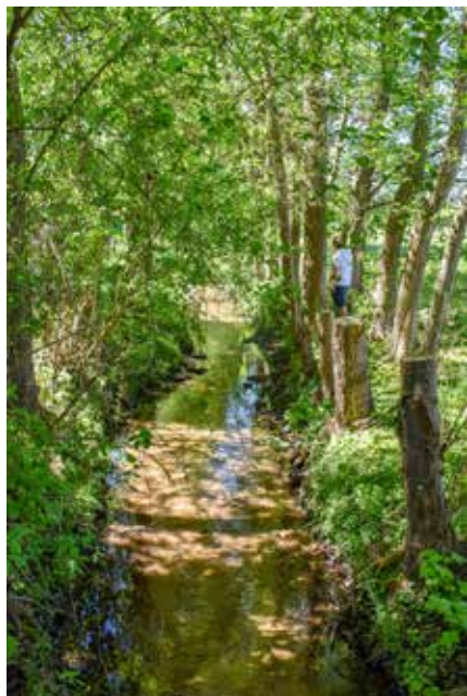
Strahlende Sonnentage zum Auftanken an der Rodau von der Quelle bis nach Rodgau und weiter

Während des Studiums: kein Geld, kaum Gelegenheit nach einem langwierigen schweren Autounfall. Aber glücklich zuhause in Bayern. Später dann: drei eigene und zahlreiche Pflegekinder, fünf Sprösslinge waren eigentlich meist im Haus – dazu ein