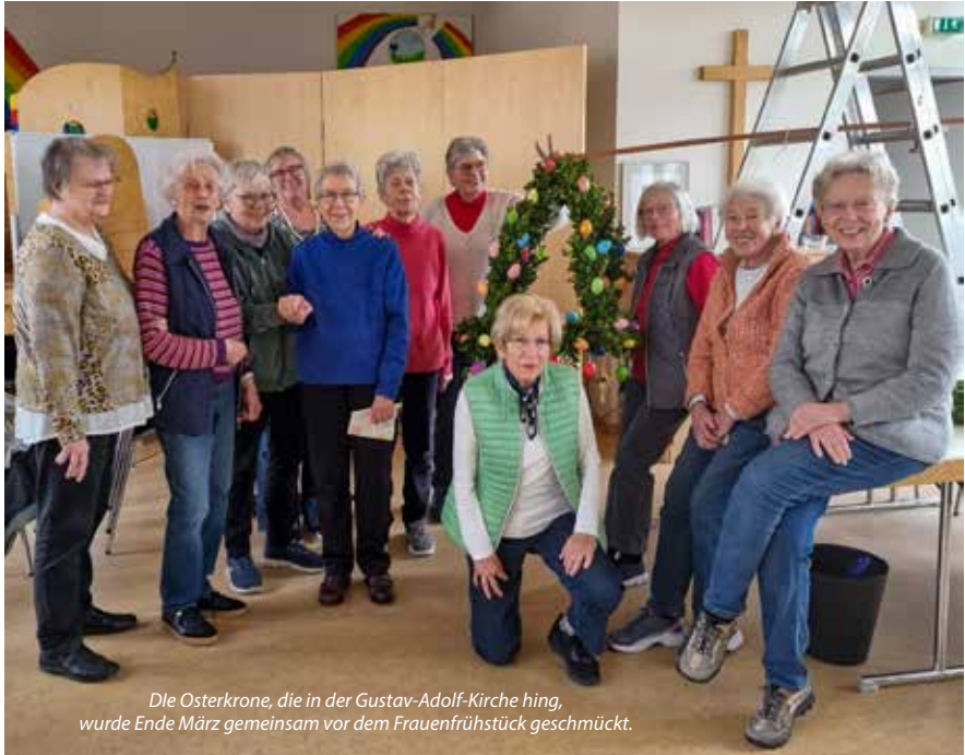
Die Osterkrone, die in der Gustav-Adolf-Kirche hing, wurde Ende März gemeinsam vor dem Frauenfrühstück geschmückt.