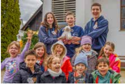
Die vier Kleingruppen „Schäfchen“, ...„Löwen“ und ...