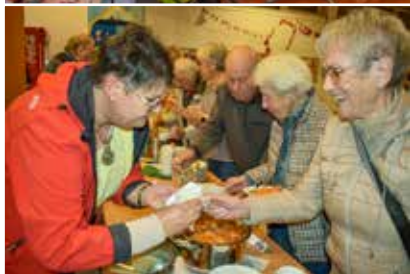
Der Gitarren- und Flötenkreis begleitete den Gottesdienst Leckeres von salzig bis süß nach Rezepten von nigerianischen Frauen gab's nach dem Gottesdienst

– das sind gerade in diesem Land überwiegend Sorgen wegen Armut, wegen Angst vor Verschleppung, wegen schlechter Lebensaussichten, wegen einer Ausbeutung der Natur, wie an vier Schicksalen gezeigt wurde. Doch die Nigerianerinnen leben in ihrem Glauben, wie gerade die Lieder bewiesen, mit denen ein großer Instrumentalkreis den Gottesdienst bereicherte: „God is so good!“ Sie vertrauen darauf, dass sie ihre Lasten bei Gott ablegen können.