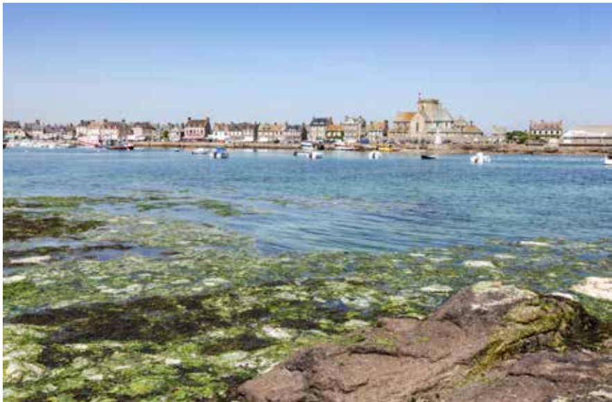
Die Hafenstadt Barfleur auf der Halbinsel Cotentin der Normandie

Aber zur Ruhe kommen fällt vielen schwer. Der Kopf lässt sich nicht so leicht abschalten, die telefonische Verfügbarkeit tut ein Weiteres. Reines Nichtstun, statt Bauwerke der Gegend zu bewundern, klingt nicht gut, wäre aber passend als Erholung.