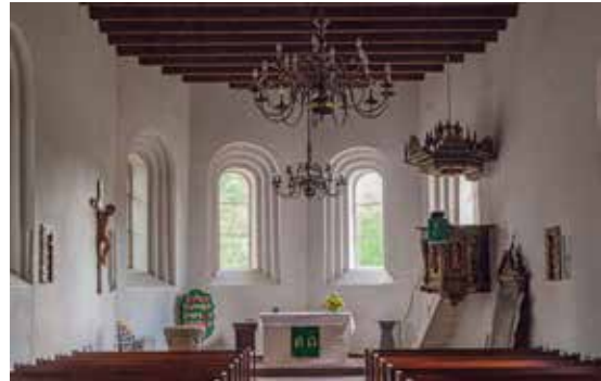
Die Kirche St. Nikolai in Wilhelmshavener Stadtteil Heppens

Der schönste Teil des „Auftankens“ im Urlaub, aber auch zu Hause, ist das Bereiten der Abendmahlzeit. In Frankreich hieß das über die Märkte gehen, Inspiration holen, ob Fisch oder Fleisch, und welches Gemüse dazu passt. Das Essen selbst mit passendem Wein ist dann der Höhepunkt des Abends. Ruhig im Sessel sitzend, auf der Terrasse, Veranda oder im Garten, ist Auftanken pur.