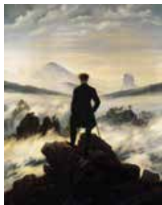
Caspar David Friedrich „Der Wanderer über dem Nebelmeer“