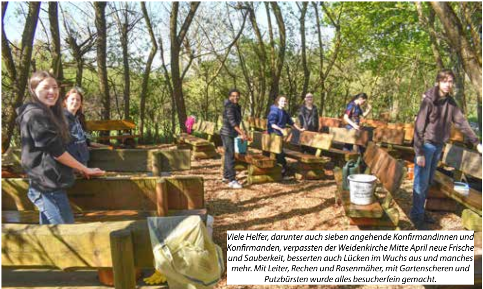
Viele Helfer, darunter auch sieben angehende Konfirmandinnen und Konfirmanden, verpassten der Weidenkirche Mitte April neue Frische und Sauberkeit, besserten auch Lücken im Wuchs aus und manches mehr. Mit Leiter, Rechen und Rasenmäher, mit Gartenschere und Putzbürsten wurde alles besucherfein gemacht.