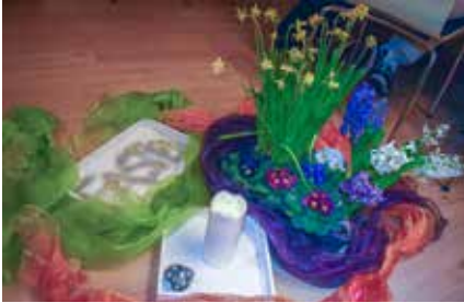
Um dieses blumige Stillleben sammeln sich die Fastenden jeden Abend, um über ihren Tag, ihre körperliche und seelische Verfassung zu berichten

und an die tägliche Gesprächsrunde noch eine Aktion anhängen – mal wird meditiert, mal werden Kräuter in Töpfen angesät, Gewürzsalz zubereitet oder Papier geschöpft und mit Samen zu kleinen Kunstwerken verarbeitet. Mal werden aber auch – kurz vor dem gemeinsamen Abfasten – am letzten Abend erste Leckereien wie kleine Kuchen