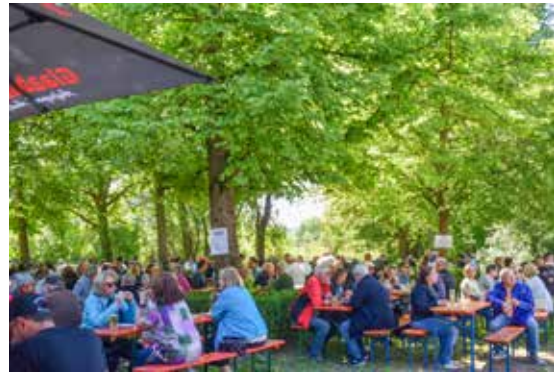
Viktoria Maiforelle: Wer nicht so viel Ruhe braucht, findet hier immer irgendwo einen schattigen Biergarten – bei der Germania, der TS, der Viktoria oder bei einer der Rödermärker Wirtschafte

allernächsten Umgebung anzuschauen, ein Orgelkonzert in einer Kirche oder Sommeraktionen zu besuchen, die auf der Homepage des Dekanats regelmäßig aktualisiert angeboten werden ( https://ev-dekanat-dreieich-rodgau.de ). In der Schlosskirche Philippseich, der Burgkirche Dreieich etwa oder der Stadtkirche in Langen?