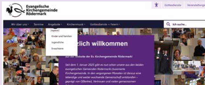
Screenshot der Homepage www.GOCKELundFISCH.de

Die Veranstaltungen finden meistens in den Gemeindehäusern in Ober-Roden und Urberach statt. Ansprechpartner, Veranstaltungstage und weitere Informationen finden Sie unter den Reitern „Angebote“ und „Kirchenmusik“ auf der Homepage: