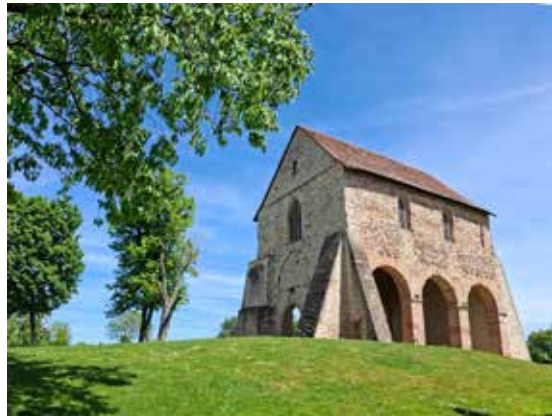
Fragment der ehemals riesigen Klosterkirche

Anmeldungen zum Ausflug sind am 12. August während des „Gemütlichen Nachmittags“ für Seniorinnen und Senioren im Gemeindehaus Urberach möglich und ab dem 13. August im Gemeindebüro in Ober-Roden (Tel. 9 40 08), jeweils verbunden mit einer Anzahlung von 15 €.