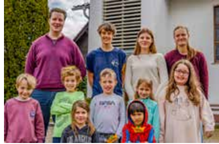
...„Krönchen“, ...„Harfen“ mit ihren Teamer*innen