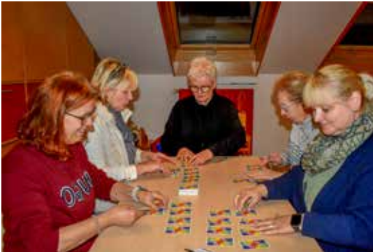
Christine Ziesecke (Text und Fotos)

Zwei Tage vor dem gemeinsamen Fastenbrechen mit Matzenbrot und einem Schluck Fruchtsaft war Spieleabend angesagt. Aus dem gemütlichen Dachstudio des Gemeindehauses in der Wagnerstraße drangen lautes Gelächter und fröhliche Unterhaltung. An diesem Abend waren es die Domino-Variante „Mexican Train“ und das unterhaltsame Kartenspiel „Skyjo“, welche die Gruppe ausgesprochen gesellig vereinte (und natürlich war es auch die Aussicht auf das baldige Ende der gar nicht so schlimmen Fastenqual).