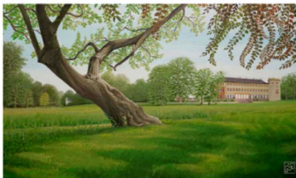
"Trompetenbaum" Öl a. LW 40 x 40 cm

„Das Malen in der Umgebung von Weinbergen, einer Wiese, einem Baum in der Natur stimmt mich heiter und gelassen“.