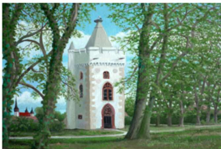
"Storchenturm" 24 x 18cm Öl a. Holz

Nach seinem Studium in Berlin folgte seine zweite Schaffens- periode die sich eng mit dem Landschaftsbild auseinandersetzt. Der Herrnsheimer Park war dabei Ausgangspunkt zahlreicher Exkursionen mit dem Fahrrad in das Hügelland und stellt in dieser Werkreihe ein häufiges Motiv.