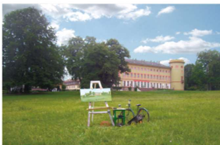
Maler im Schlosspark 2015