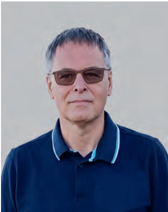
Axel Klein; Foto privat

Kirche findet heute längst nicht mehr nur unter dem Kirchturm statt. In einer Welt, die sich immer schneller vernetzt, ist die „digitale Kirche“ ein fester Bestandteil unseres Gemeindelebens geworden.