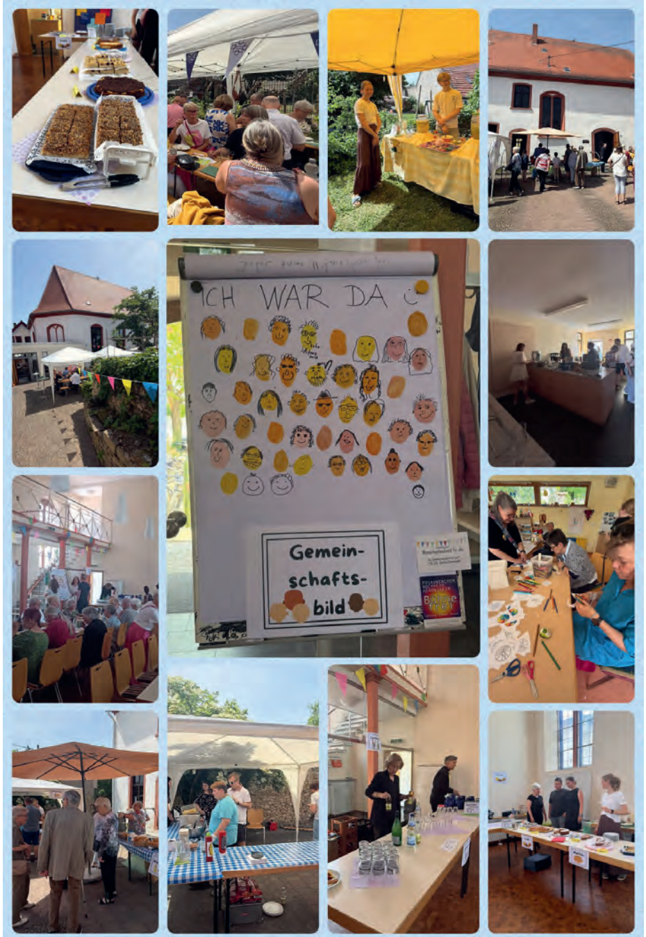
Gestaltung: © Andrea Schäfer