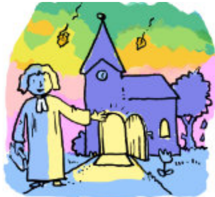
Grafik: Pfeffer / gemeindebrief.evangelisch.de