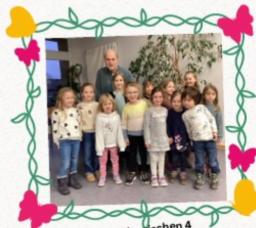
Wir sind zwischen 4 und 7 Jahre alt.

Wir sind der neue Kinderchor und wir heißen