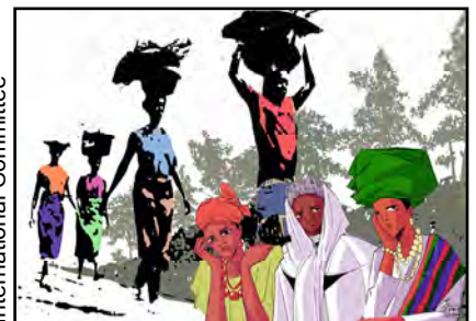
Titelbild zum WGT 2026