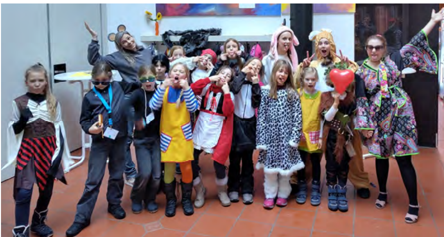
Action beim Jungschar-Fasching in Groß-Karben