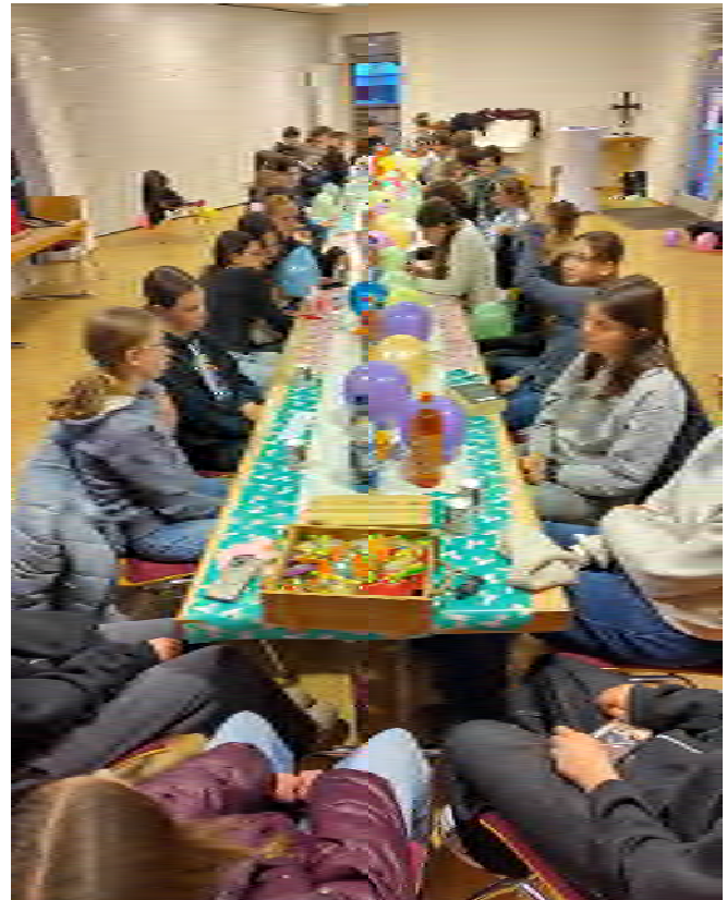
Konfis: die große Festtafel zum Gleichnis des verlorenen Sohnes