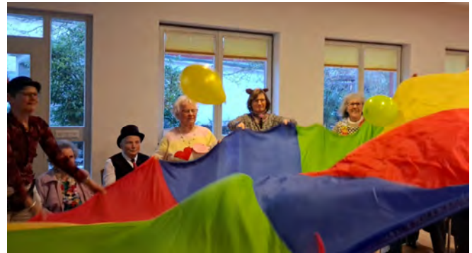
Klein-Karben: Ein bunter Faschingsnachmittag der Senioren