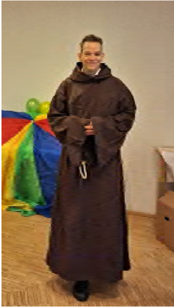
Fasching in Klein-Karben: Mönch mit Humor