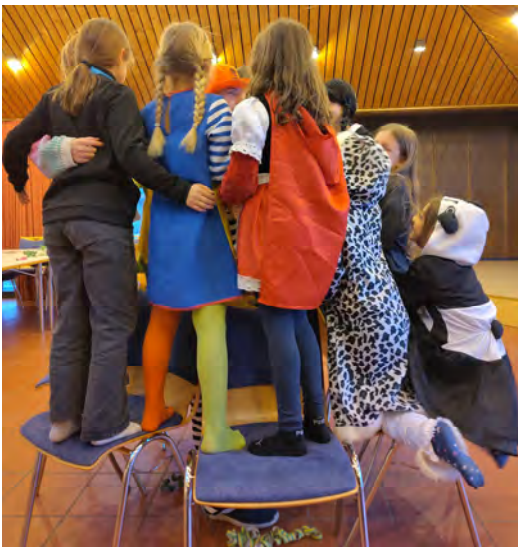
Action beim Jungschar-Fasching in Groß-Karben