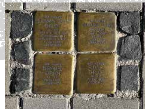
An der Walkmühle 19a