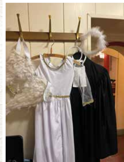
Pfarrerin und Engel- chen teilen sich die Sakristei