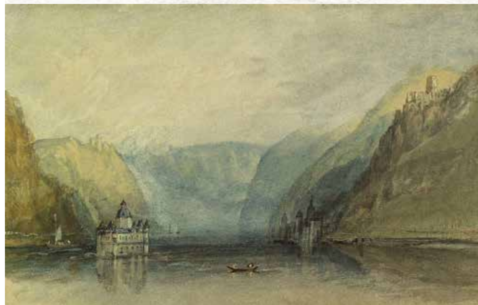
William Turner 1817