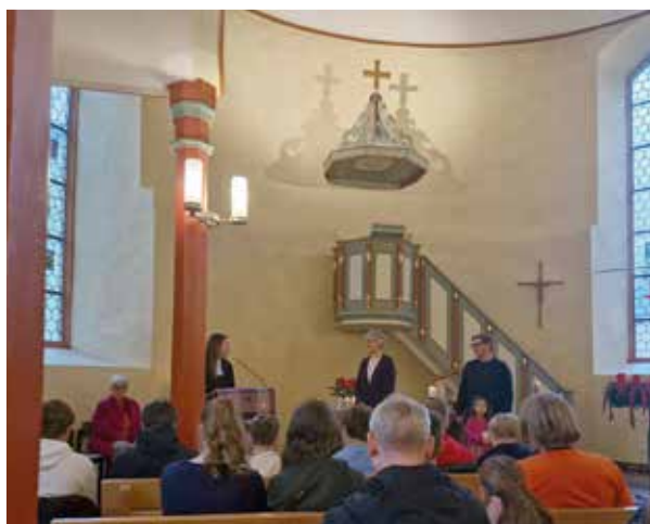
Segnung der Lektoren in Ausbildung