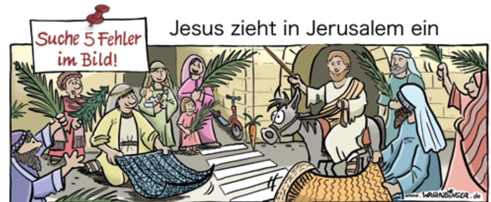
Tannenbaum, Babyflasche, Zebrastrifen, Roller, Karotte

In der Stadt Jerusalem ist viel los! Auch Jesus kommt nach Jerusalem. Er reitet auf einem kleinen Esel. Viele Menschen freuen sich sehr. Sie winken mit Zweigen von Palmbäumen und rufen: „Hosanna!“ Die Menschen benutzen Palmzweige, weil Palmen damals ein Zeichen für Freude und Sieg waren. So zeigen sie: „Jesus ist uns wichtig. Wir freuen uns über ihn, er ist wie ein guter König!“ (Markus 11, 1-11). An Palmsonntag erinnern wir uns daran und erzählen diese Geschichte. In unserem Bild haben sich wieder 5 Fehler eingeschlichen. Findest du sie?