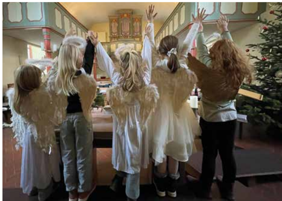
Die himmlischen Heerscharen