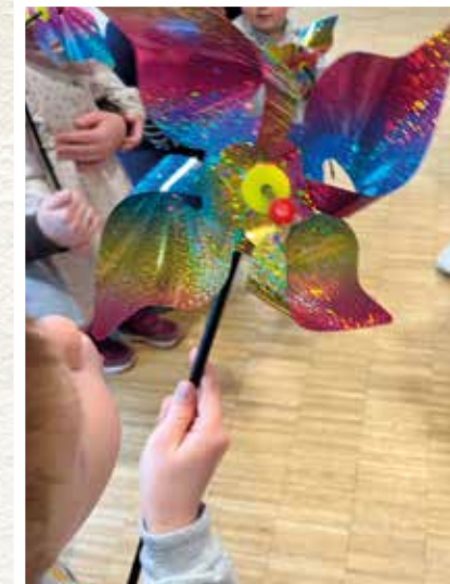
Den Atem Gottes im Gottesdienst mit Kindern spüren, © Malsy