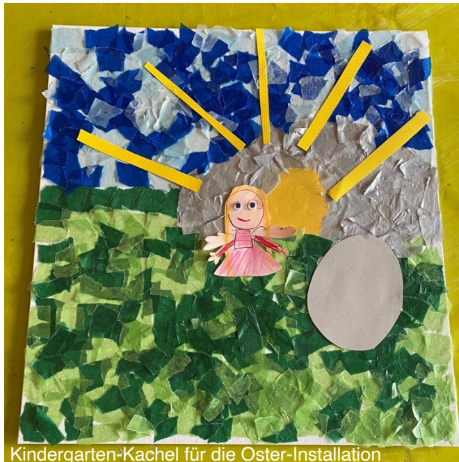
Kindergarten-Kachel für die Oster-Installation

Dienstags und freitags sind Sie um 18:50 Uhr zu dem kurzen, meditativen Gottesdienst 10-vor-7 GOTTKONTAKT im Gemeindehaus eingeladen.