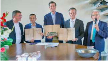
Die Privilegien als Gastgeschenk.

Das war sicherlich nicht alles, was ich zu berichten habe, aber hierbei belasse ich es vorerst für die nächsten Monate. Meine Frau, die Pfarrerin in der Christuskirche in Dietzenbach ist, teilt sich die Erziehungszeit mit mir auf. Einen kleinen Dienstauftrag behalte ich während der Zeit, sodass ich an einigen Sonntagen Gottesdienste halten werde, wie z.B. am Ewigkeitssonntag und an Weihnachten.